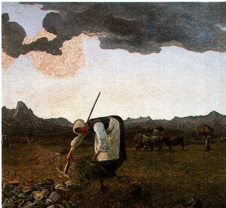
La raccolta del fieno [1888ca. e 1898], Museo Segantini, San Moritz