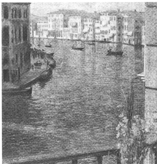
Umberto Boccioni, Il Canal Grande a Venezia, 1907