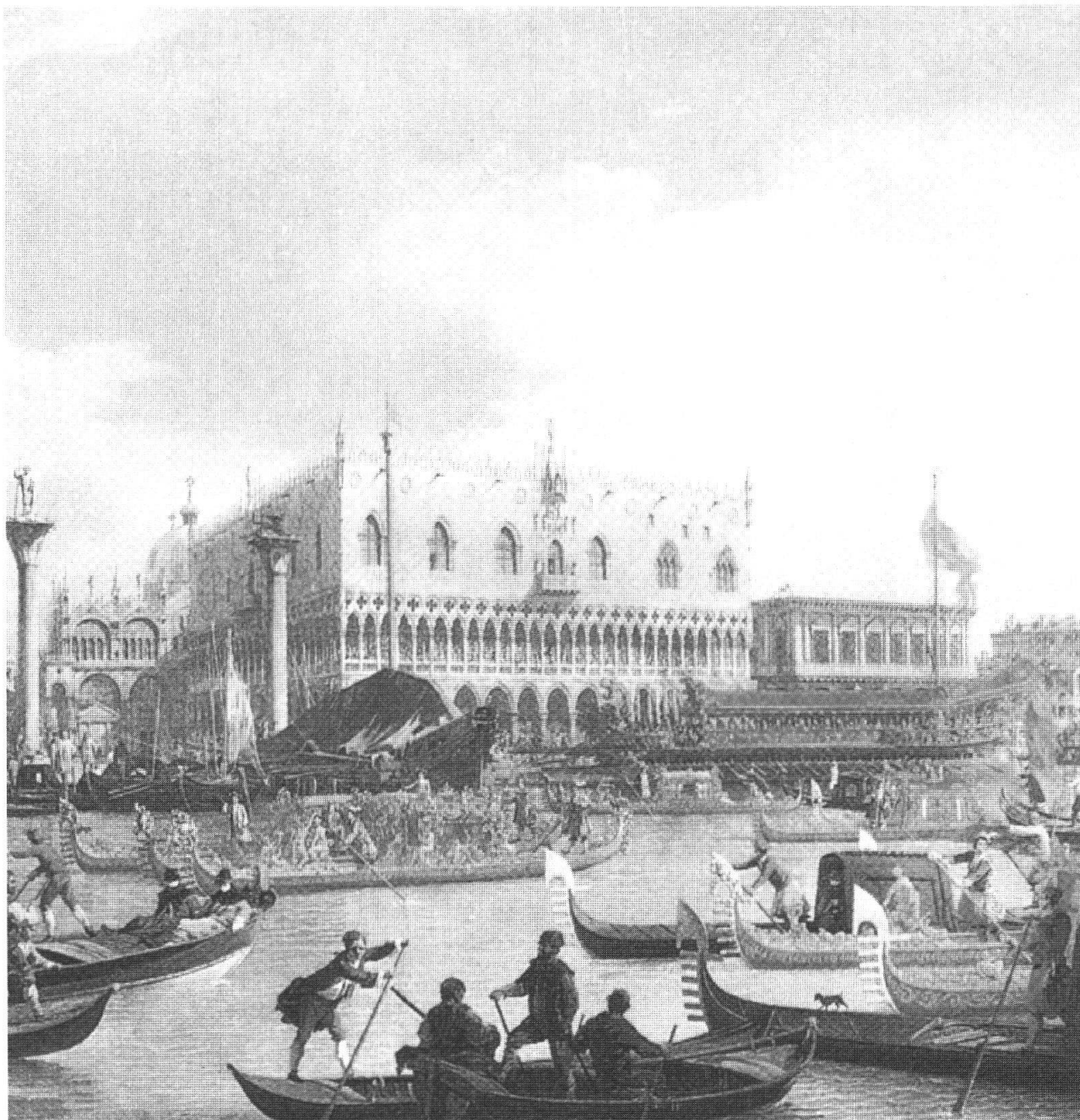
Canaletto, Sposalizio del Doge e del mare, particolare

E con Monteverdi, maestro di cappella di San Marco (1613) la scuola veneziana porterà un contributo formidabile allo sviluppo del melodramma. Il San Cassiano fu il primo teatro pubblico che si aprì all'opera in musica (1637), e Venezia divenne ben presto in tal campo il primo mercato artistico d'Europa.