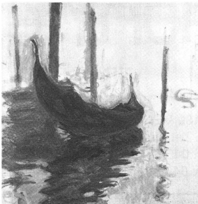
Claude Monet, Gondole a Venezia , 1908

L'antico concerto è il celeberrimo Concerto in Re minore per oboe ed archi di Alessandro Marcello, già attribuito al fratello, Benedetto Marcello, e prima ancora a Vivaldi. Giuseppe Berto lo evoca, incantesimo struggente, nella pagi-