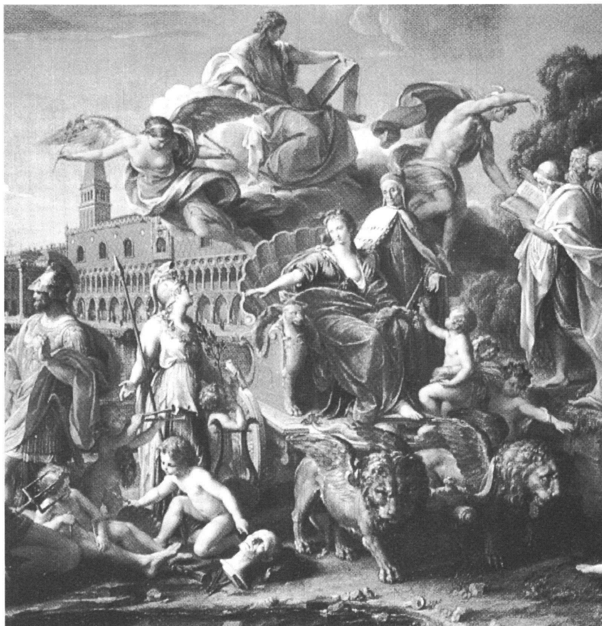
Pompeo Batoni, Trionfo di Venezia, North Carolina Museum of art