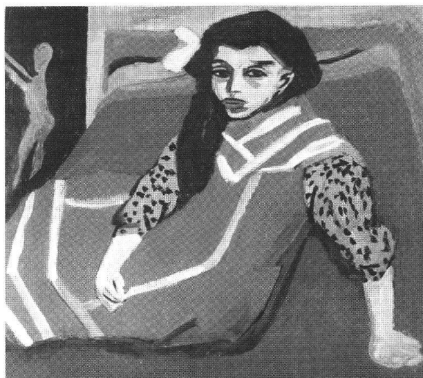
Sitzendes Mädchen: Fränzi, 1910-20, 79.3x89.5 cm, Institute of art Minneapolis

Il corposo catalogo edito da Skira con 180 illustrazioni disponibili in tedesco e italiano è curato dal direttore del Museo Rudy Chiappini il quale ripercorre i momenti fondamentali della parabola artistica del pittore con i contributi di esperti del movimento espressionista tedesco. La biografia è invece affidata a Barbara Paltenghi. La mostra rimane aperta fino al 2 luglio.