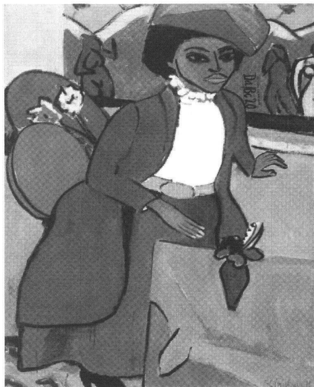
Frauenbildnis, 1911, 119.3x89 cm, Albright-Knox Art Gallerx, Buffalo, New York

I pittori della «Brücke» prediligono rappresentare in modo «immediato e genuino» l'ambiente circostante o le figure degli amici aderenti al gruppo. Kirchner non si sottrae a questa regola e usa il virtuosismo cromatico che si esprime nella contrapposizione di colori e vigorosi tratti di pennello corti e pastosi che spesso sfumano in passaggi cromatici più sottili. Nel periodo che l'autore trascorre a Fehmarn, sul mar Baltico, il colore si adegua alla luce calda e quasi meridionale dell'estate al mare. Dipinge fattorie, la vegetazione circostante o la spiaggia