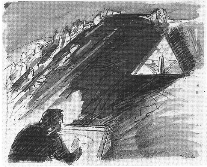
Paolo Pola, Confrontazione, 1980

mente consapevole della condizione umana. E ha sempre mantenuto, Pola, una sua particolare carica esplosiva che travolge, sovverte e sconvolge il tradizionale linguaggio della pittura, provocatoria bandiera di una diversa e accattivante concezione dell'essenza e della funzione dell'arte.