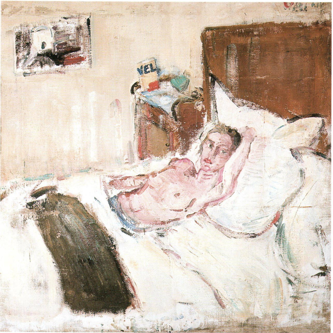
Varlin, Franca a letto a Sant'Angelo d'Ischia, 1961, olio su tela, 90.5x95.5 cm, collezione privata (cat. 1063)