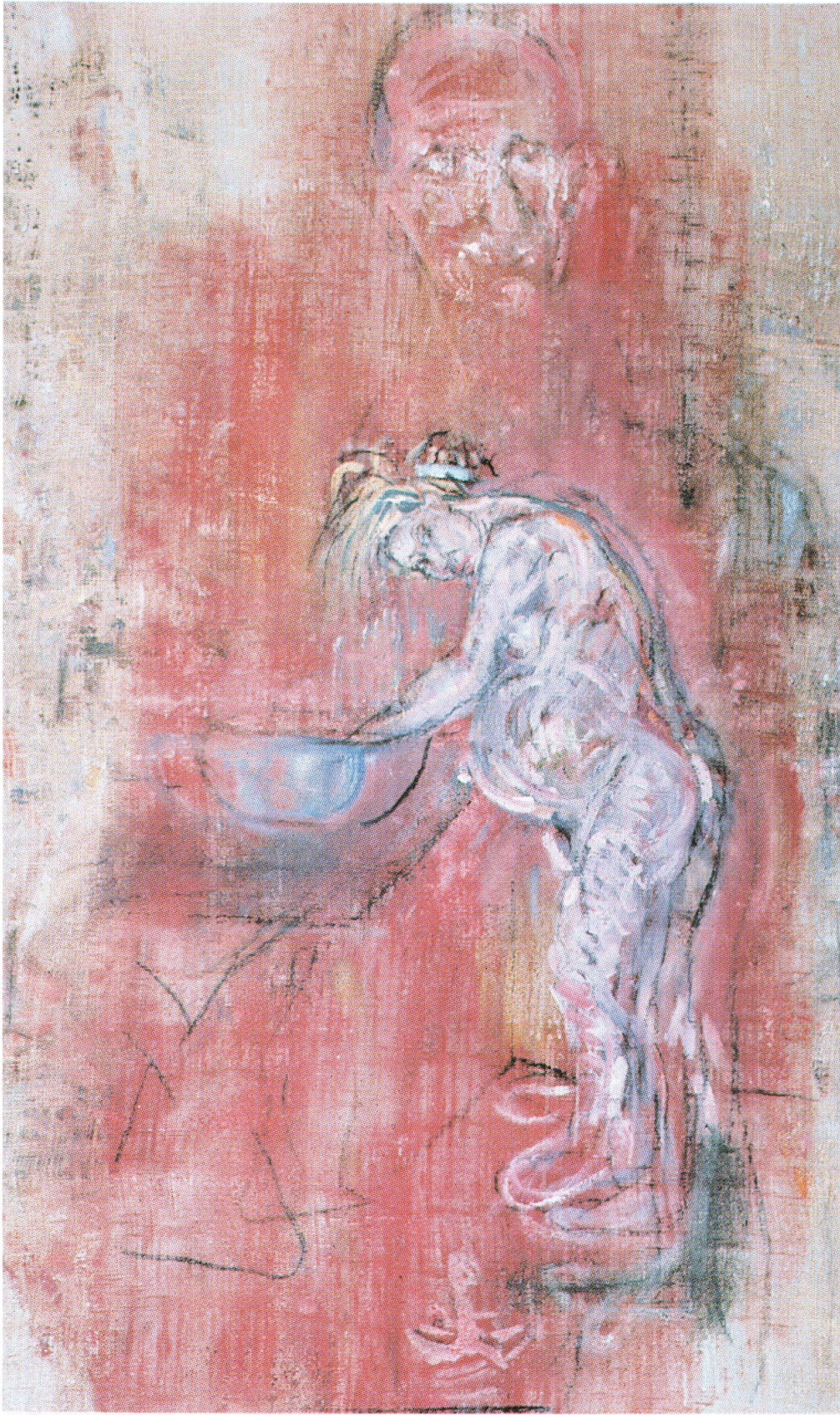
Varlin, Franca, incinta, si lava i capelli, 1965, olio e carboncino su tela, 135.5x74.5 cm, collezione privata (cat. 1159)