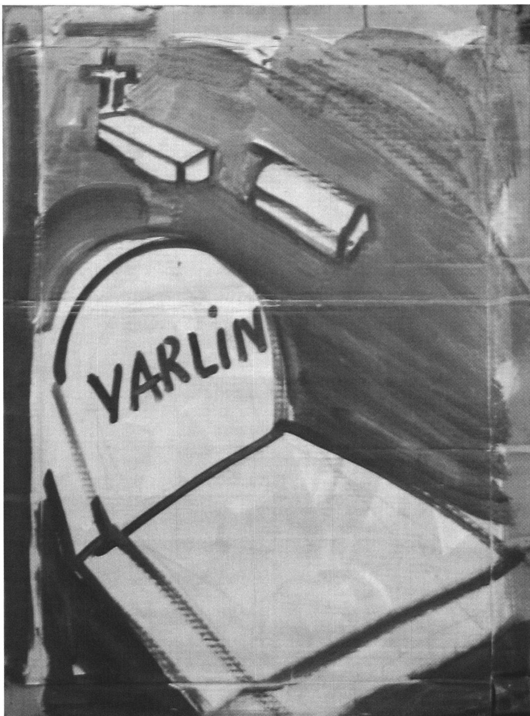
Varlin, Schizzo per la propria lapide, ca. 1976, guazzo su cartone, 78x106 cm, collezione privata