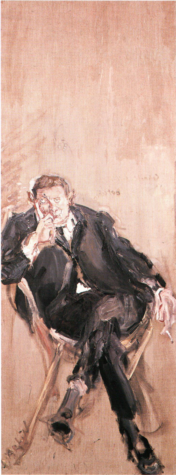
Varlin, Lo scrittore Dr. Hugo Loetscher, 1964, olio e carboncino su tela, 239x86 cm, collezione privata (cat. 1137)

per il mio sviluppo difettoso che aveva sfidato le muse. Il mio difetto indusse Varlin a dipingermi una seconda volta, un quadro che mi costò infinite sedute.