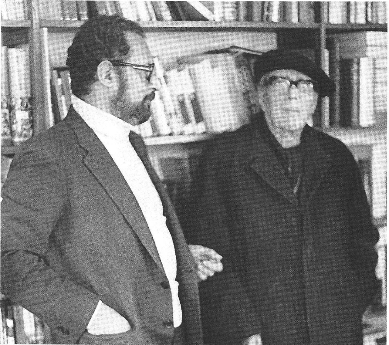
Grytzko Mascioni con Giuseppe Prezzolini

di fronte al mio proprio lavoro e di permettermi di vedere che questo lavoro è stato coronato da un riconoscimento pubblico importante. A posteriori il premio dà un significato a cose che magari si erano trascurate prima, ma nello stesso tempo dà un senso di responsabilità, soprattutto visti i nomi degli scrittori che hanno già ricevuto questo premio.