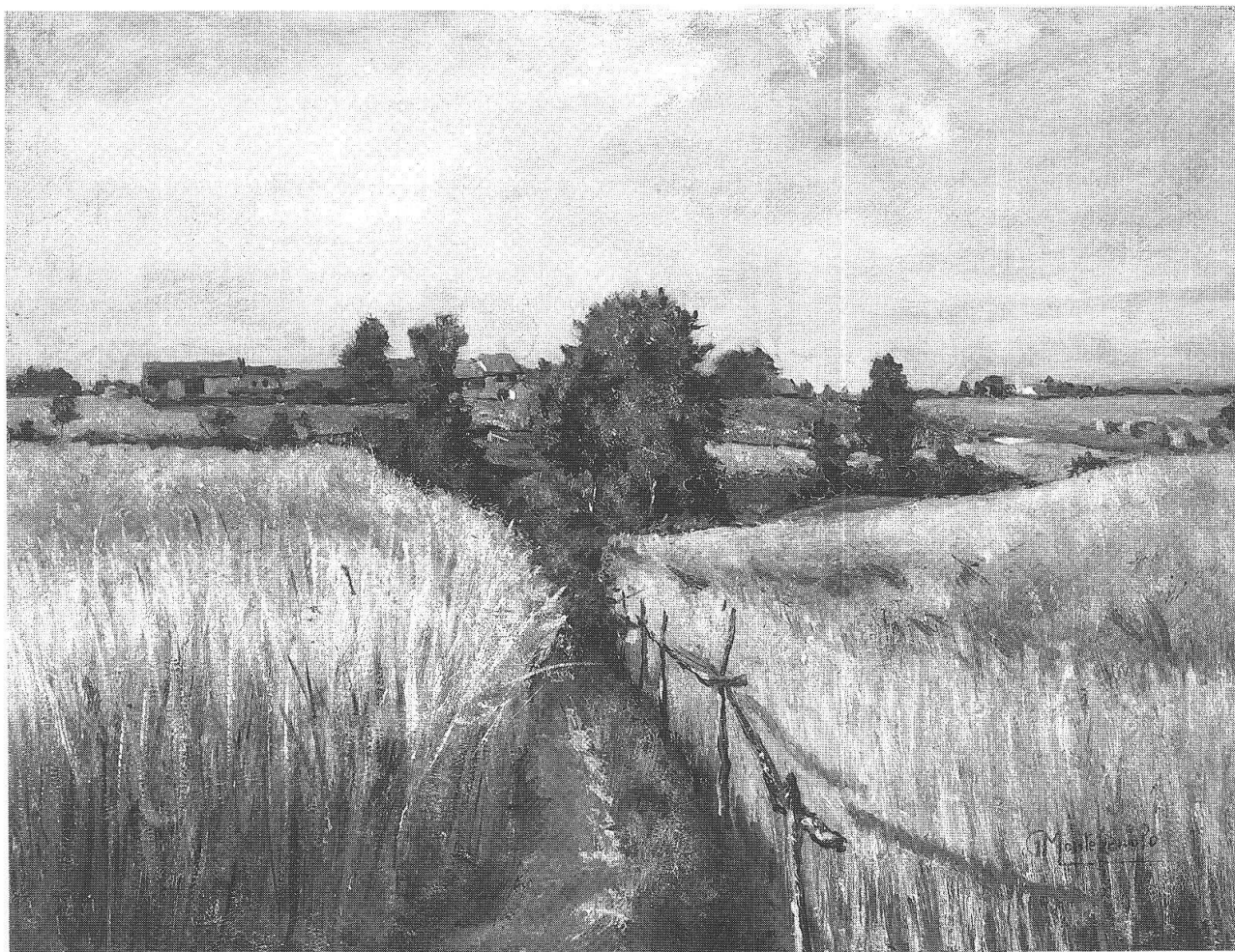
Campo di grano, olio su compensato, 64,1x49,7 cm.

le situazioni della vita con una vena poetica e narrativa che si traduce in immagini di incantato lirismo, siano esse paesaggi o persone o ancora interni domestici o piazze di paese.