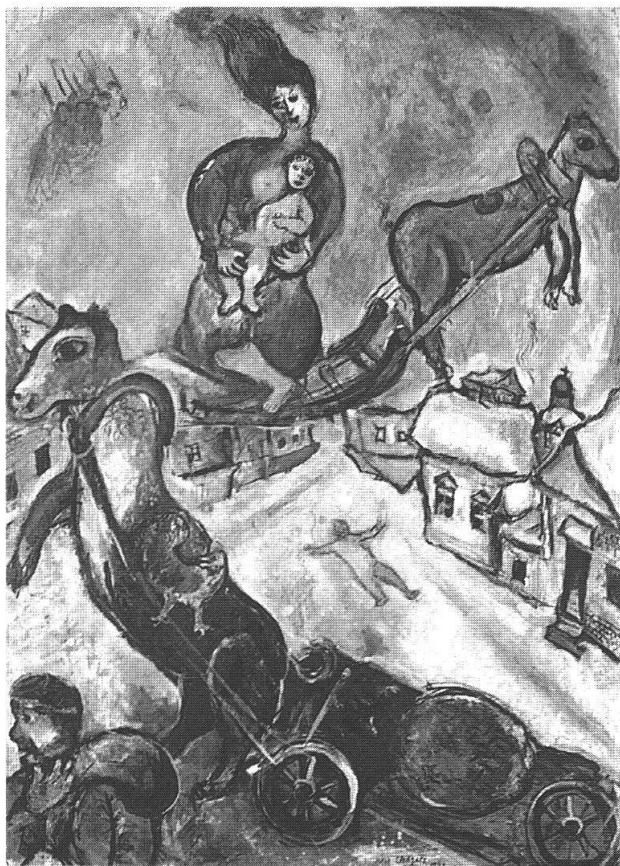
La guerre, 1943, 106x76 cm.

Chagall prende avvio da vissuti quotidiani e ricordi personali e il risultato finale è più un luogo poetico, una realtà onirica che una trasposizione oggettiva vera e propria.