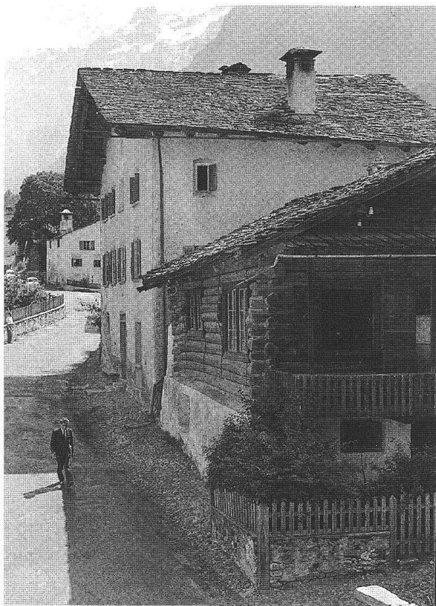
Ernst Scheidegger, Alberto Giacometti a Stampa davanti alla casa e all'atelier, 1960

Alberto amava soprattutto l'inverno bregagliotto, con i suoi colori tipici, il grigio delle rocce, l'azzurro del cielo, il verde cupo dei pini e l'ocra del paesaggio. Erano le sue tonalità preferite, quelle che spiccano anche nelle sue opere parigine. E inoltre in Bregaglia era solitamente più tranquillo, più quieto, lavorava infatti meno intensamente che non a Parigi. Nella capitale francese il lavoro per lui era invece quasi un'ossessione. Lavorava praticamente giorno e notte. Tornava in Bregaglia alla ricerca della quiete che non trovava nella frenetica metropoli parigina. Qui conduceva un'esistenza piuttosto disordinata, in Bregaglia invece doveva piegarsi all'ordine e alla disciplina della madre Annetta, una personalità dominante, severa, sicura di sé. Il legame con la sua valle, in fondo, contrariamente a suo fratello Diego, non si è mai spezzato.