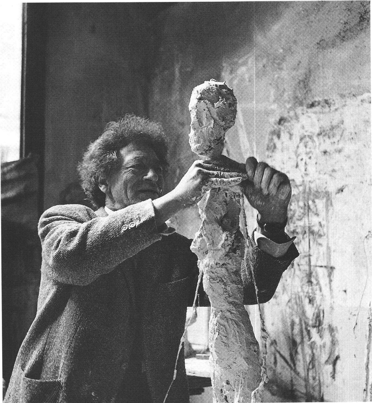
Alberto Giacometti, (manca la data)

il governo grigionese, e questo mi è stato chiesto spesso, non lo so. Ufficialmente la Svizzera al funerale era rappresentata dal consigliere federale Hans Peter Tschudi. Di quel giorno mi ricordo che faceva un freddo polare, il termometro era sceso 22 gradi sotto lo zero. Anche la chiesa non era riscaldata, faceva un freddo terribile; furono in tanti a tenere dei discorsi e il pastore sembrava non volesse terminare la sua omelia. Colse infatti l'occasione per cantargliele all'illustre comunità che si era riunita per rendere l'ultimo omaggio ad Alberto.