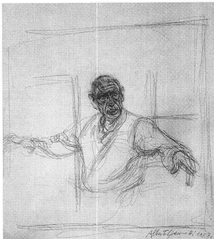
Ritratto di Igor Stravinsky, 1957, proprietà privata

Fissava assorto per ore un volto, un albero, un bicchiere, un raggio di sole: e cercava di riprodurre lo stupore di quello sguardo. Era straordinaria la concentrazione di Alberto Giacometti sul lavoro. Una sua testimonianza: «Quando per la prima volta vidi chiaramente che la testa si pietrificava, si immobilizzava, in un istante mi accorsi che non era più una testa viva ma un oggetto, che guardavo come un qualsiasi altro oggetto. Oppure no! Non era