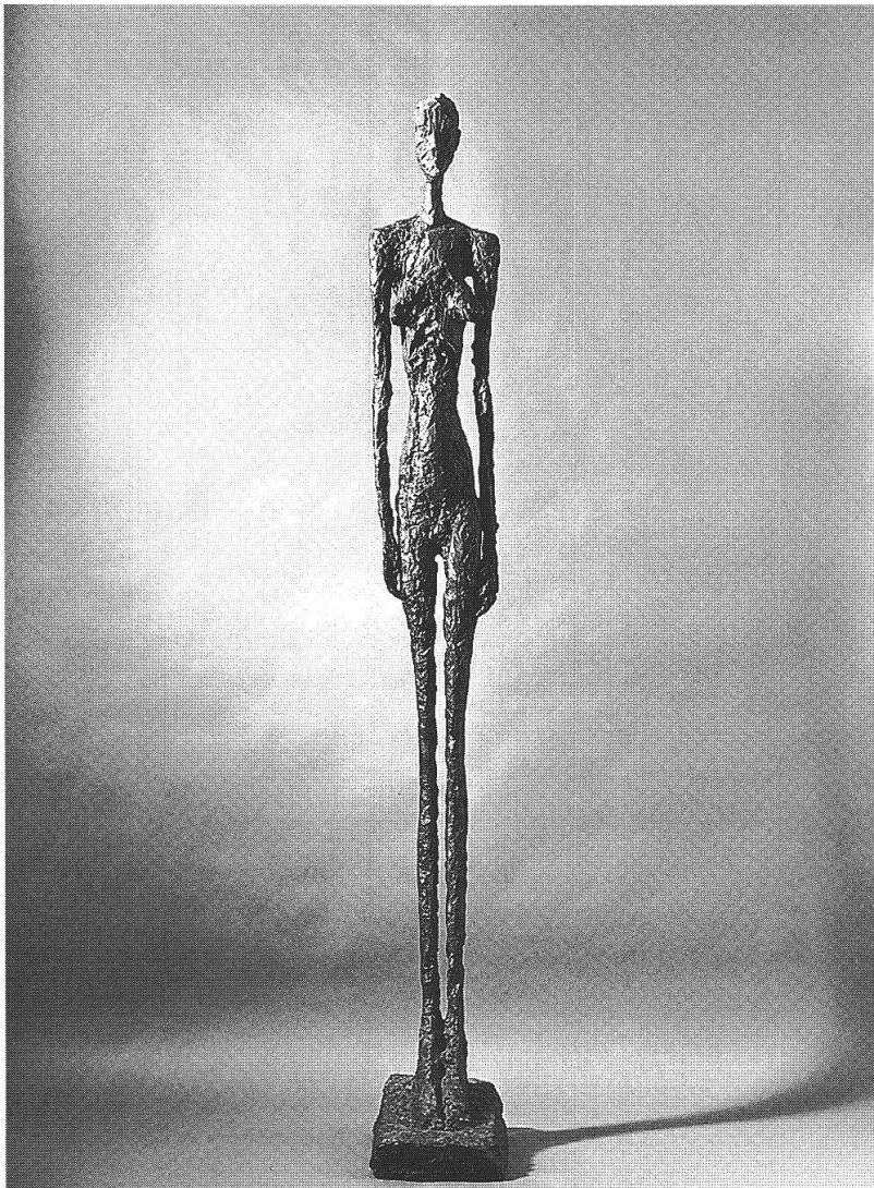
Grande donna II, 1960, Fondazione Maeght, Saint-Paul

Resta, questo artista, come un mistero: privo di speculazioni, di «metadiscorsi»; sconcertato, sì, davanti alla sostanza inquieta della natura umana, ma con un suo antifilosofico candore, da vero artigiano, attento soprattutto al dato pratico del fare. Eppure, paradossalmente, capace di suscitare speculazioni d'altri; di stimolare, in altri, ferventi scritture creative in veste di parole. Hanno parlato di Giacometti insigni scrittori; nel farlo, parlano di se stessi e la loro pagina critica è un volo di fantasia. Ciò, in parte, sempre accade in ogni lettura sensibile, in ogni interpretazione scientifica e «impura». Ma, con Giacometti... dalla presenza ieratica delle sue figure, dall'enigma stesso della sua persona, parte un'emanazione di poesia da cui non può che nascere – per induzione, per contagio – poesia nuova! Forse è proprio ch'egli, più d'ogni altro e suo malgrado, fu voce dell'altra faccia del Moderno, del suo disastro della conoscenza, della sua silenziosa tragedia.