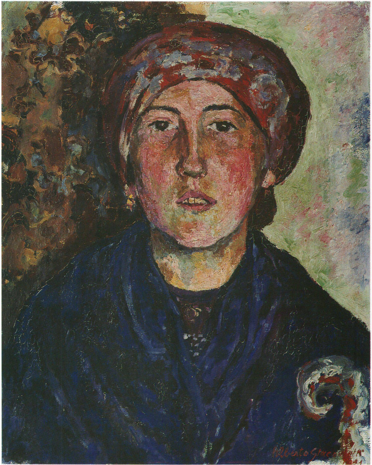
La Bregagliotta, 1921, Museo d'arte Grigione, Coira