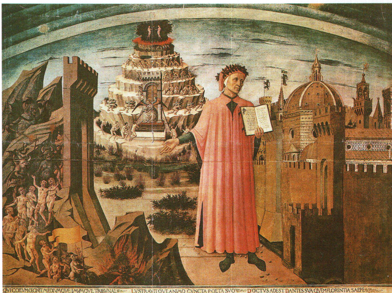
Dante e il suo poema, Domenico di Michelino, 1466, Duomo di Firenze

portabile; c'è poi la psicologia stessa di chi sale: la tentazione quasi irresistibile, dopo l'esperienza del primo sforzo, di sottrarsi alla legge del monte, di piegare a destra o a sinistra, o perfino di retrocedere, quasi ci fosse altrove una via più agevole; il senso di scoraggiamento, anzi d'impotenza che a questo punto, quando l'occhio di nuovo si rivolge verso l'altura e non ne scorge la fine, s'impadronisce dell'animo; e, da ultimo, la vista che spazia liberamente, il nuovo respiro di chi, arrivato a una certa altezza, ha come conquistato una parte di mondo. E ciò non solo una volta, ma tante volte quante sono le balze.