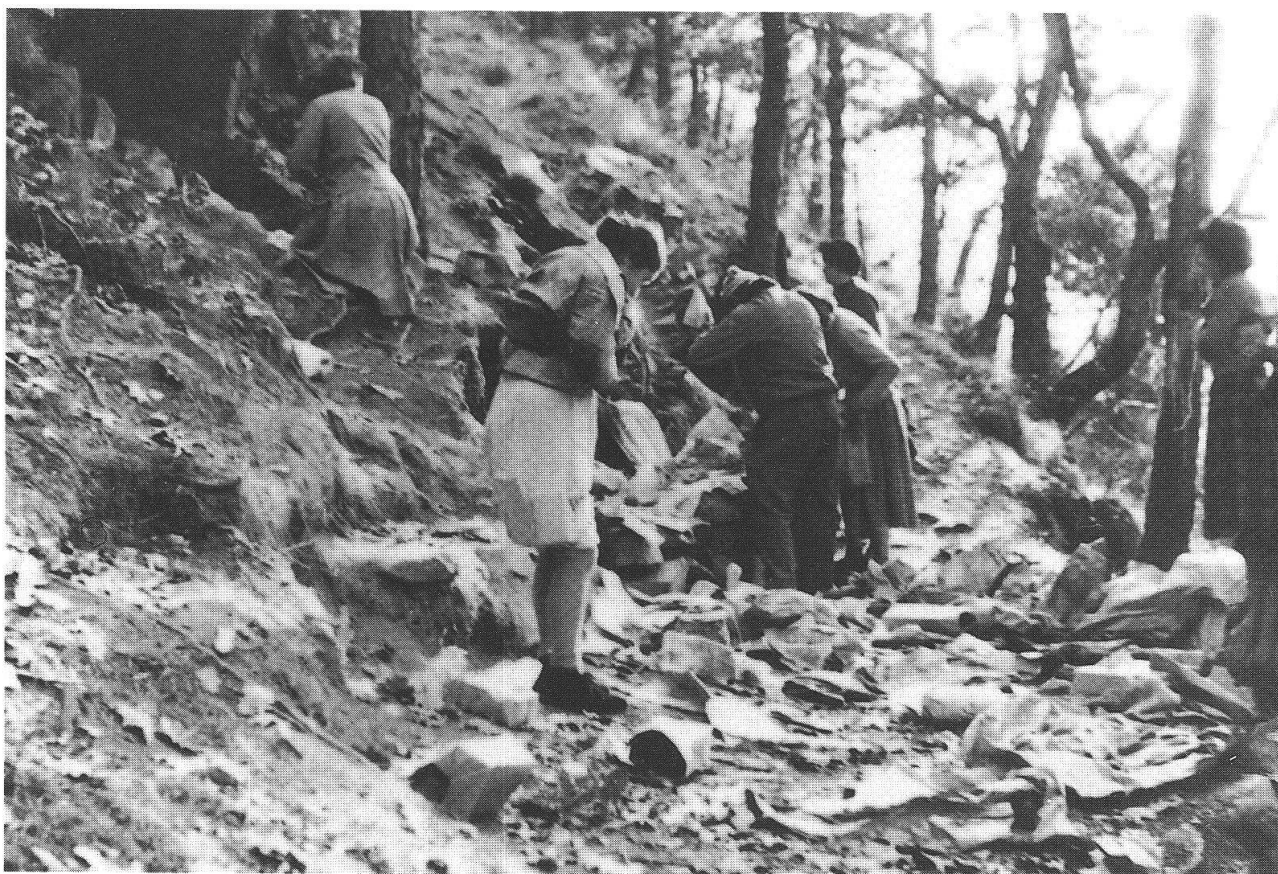
Donne contrabbandiere in zona «Nasen». Sotto la gonna nascondono le sigarette

realtà. Il film della vita si ferma, Carlo cessa di essere spettatore e, costretto a fare i conti con se stesso, non può che fare affidamento alla Provvidenza – «Me la sono cavata a Como, perché non dovrei cavarmela a Lecco?» (p. 174) – e con il sostegno della Provvidenza giungere a risolvere i suoi problemi. Per diventare veramente maturo, Carlo deve diventare artefice del proprio destino.