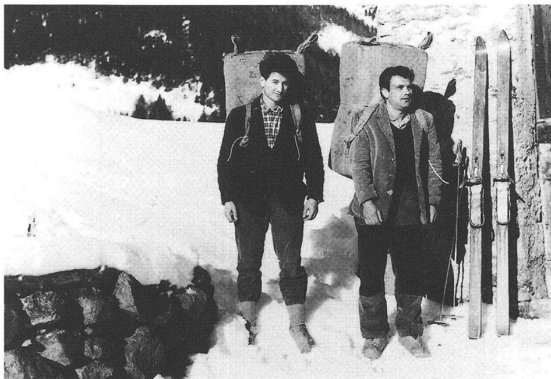
Contrabbandieri di sigarette a «La Piana - Li Masun»

ficile e Lardi è riuscito a costruire questo mondo nel quale noi lettori entriamo, è riuscito a creare questa illusione di realtà che rende la letteratura così accattivante.