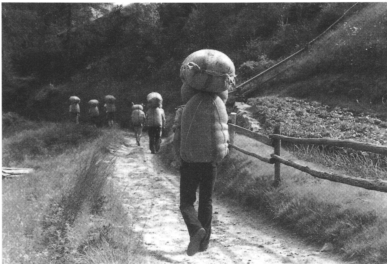
Spalloni a Viano - Dogana diretti in Italia (Baruffini)

Un altro elemento importante del libro sono le digressioni storiche, che possono sembrare un po' eccessive, ma che trovano una loro giustificazione per la coerenza con cui vengono esposte. Sono infatti affidate al narratore (e sappiamo che non dobbiamo confondere il narratore con l'autore, ma in questo caso le affinità tra narratore e autore sono molto palesi). In questo libro il narratore è qualcosa come un alter ego dell'autore: racconta una vicenda che in qualche modo è anche la sua ed è questo fatto a rendere il libro così vero, così sincero. Abbiamo un narratore molto colto, che usa un registro linguistico elevato, contrapposto a quello colorito, gergale, intriso di termini regionali, con forte influsso della parlata dialettale lombarda, usato dai personaggi. Un narratore onnisciente, che sa più del protagonista, che commenta gli accaduti e suggerisce considerazioni, che si abbandona a riflessioni moralistiche o moraleggianti, per esempio sui rischi dell'imprudenza, sulla vanità di abbandonarsi al facile guadagno del cosiddetto export due . Un narratore che usa una lingua diversa dai personaggi del libro. Quando parlano loro, come dice Eugenio Corti nell'introduzione, "si ha subito la percezione di essere in un mondo alpino nel senso più proprio del termine" e tutto questo "fa respirare al lettore un'aria che sa di montagna".