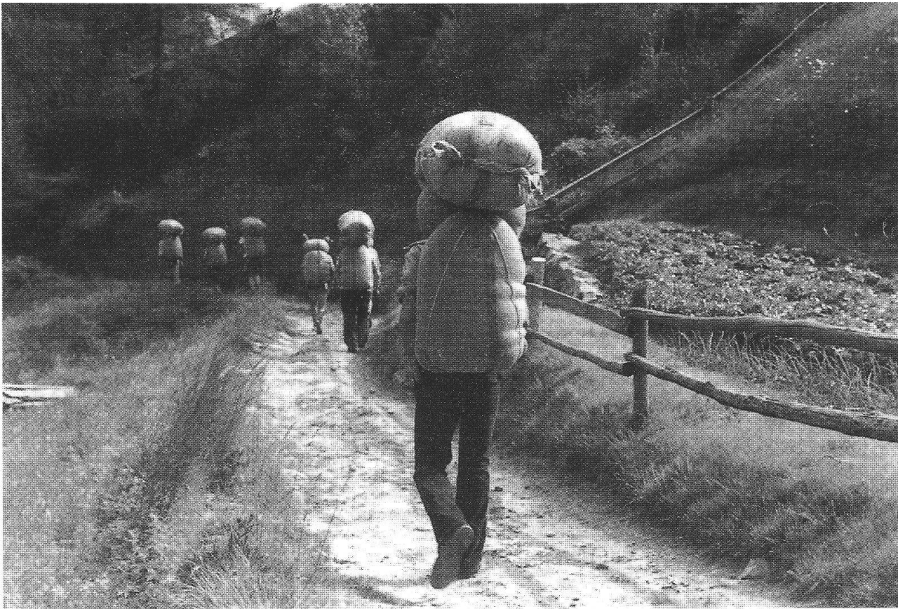
Spalloni a Viano - Dogana diretti in Italia (Baruffini)

Un altro elemento importante del libro sono le digressioni storiche, che possono sembrare un po' eccessive, ma che trovano una loro giustificazione per la coerenza con cui vengono esposte. Sono infatti affidate al narratore (e sappiamo che non dobbiamo confondere il narratore con l'autore, ma in questo caso le affinità tra narratore e autore sono molto palesi). In questo libro il narratore è qualcosa come un alter ego dell'autore: racconta una vicenda che in qualche modo è anche la sua ed è questo fatto a rendere il libro così vero, così sincero. Abbiamo un narratore molto colto, che usa un registro linguistico elevato, contrapposto a quello colorito, gergale, intriso di termini regionali, con forte influsso della parlata dialettale lombarda, usato dai personaggi. Un narratore onnisciente, che sa più del protagonista, che commenta gli accaduti e suggerisce considerazioni, che si abbandona a riflessioni moralistiche o moraleggianti, per esempio sui rischi dell'imprudenza, sulla vanità di abbandonarsi al facile guadagno del cosiddetto export due . Un narratore che usa una lingua diversa dai personaggi del libro. Quando parlano loro, come dice Eugenio Corti nell'introduzione, "si ha subito la percezione di essere in un mondo alpino nel senso più proprio del termine" e tutto questo "fa respirare al lettore un'aria che sa di montagna".