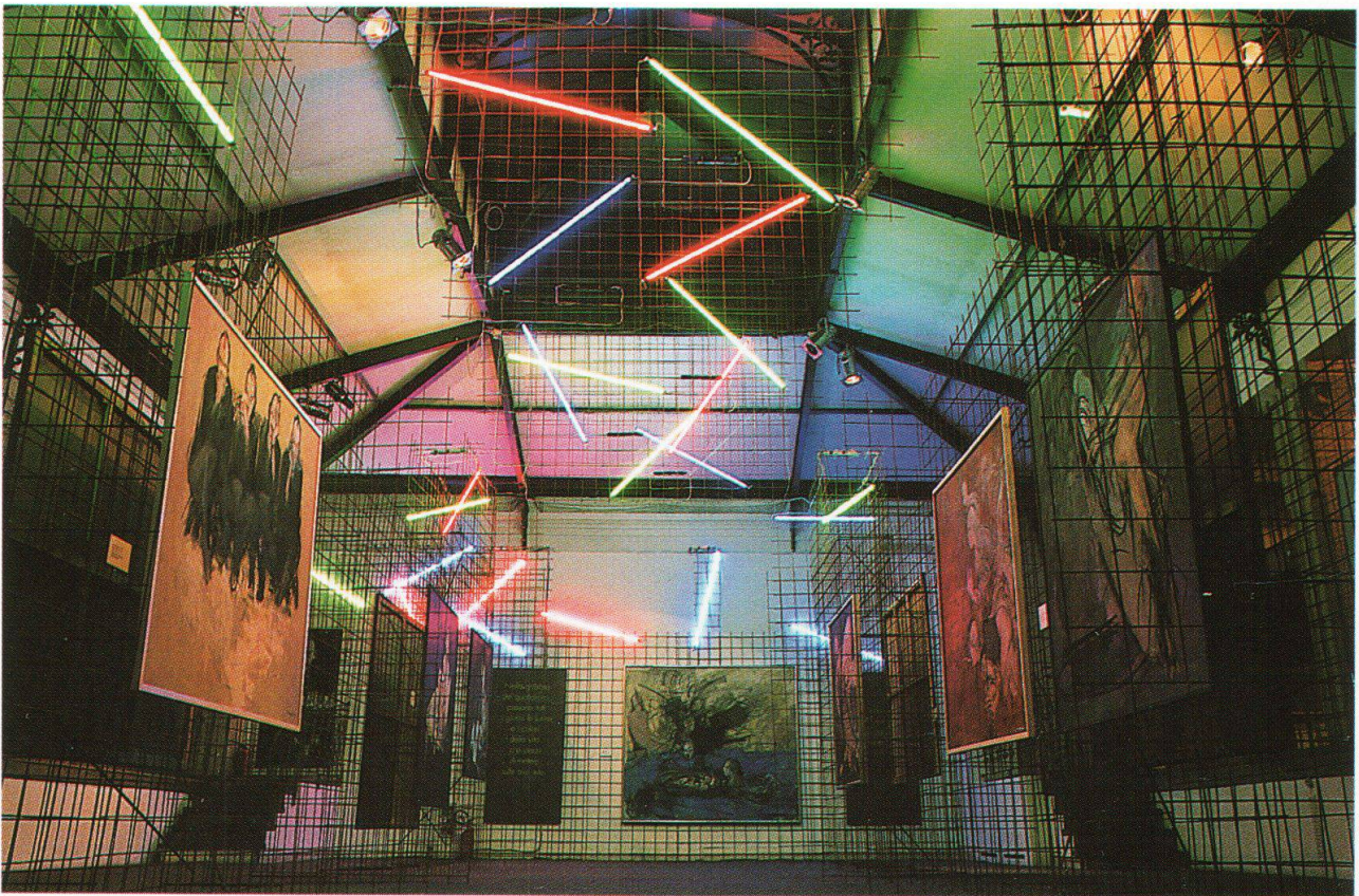
Le opere di Comensoli nella mostra di Milano

Questa messa in scena, drammatica, con una complessa struttura reticolare e di sottili fluorescenze, ha trasformato gli spazi della Posteria in una specie di ambiente urbano irreali e suggestivo, ideale per la presentazione delle opere dell'ultimo periodo. Anche il contrasto fra l'altissimo ambiente del pianterreno con le gallerie laterali ed il basso soffitto con le grosse colonne del sotterraneo, dove erano collocate le prime opere ed il periodo blu, hanno fatto di questa mostra un evento che ha entusiasmato la critica italiana. Certo, l'impostazione moderna e non convenzionale sarebbe piaciuta a Comensoli.