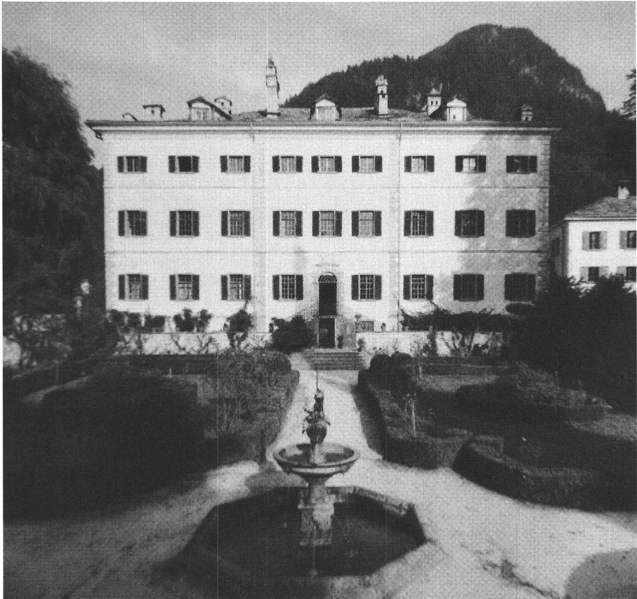
Bondo, palazzo Salis

La recente pubblicazione del già citato volume Il palazzo Salis di Bondo svela la storia affascinante di una famiglia che fortissimamente volle una villa di delizia in una severa valle ai piedi delle Alpi, all'ombra di montagne tra le più spettacolari della Rezia. La ricchezza dei documenti disponibili e lo straordinario stato di conservazione dell'edificio