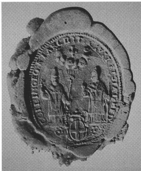
Bollo del Collegio de' Sig. Architetti, 1730 Milano, Archivio Storico Civico