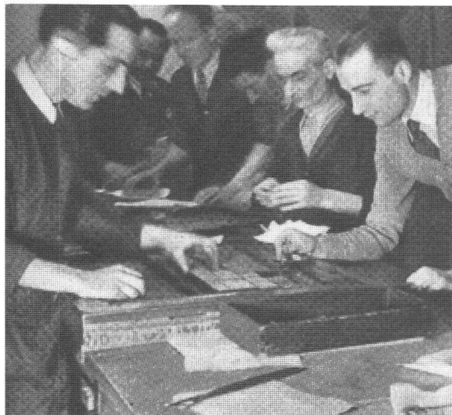
Montanelli al «Corriere della Sera» nel 1943, mentre controlla la composizione (notturna) di un suo articolo e mentre, all'ultimo momento, detta al linotipista la chiusura di un suo servizio.