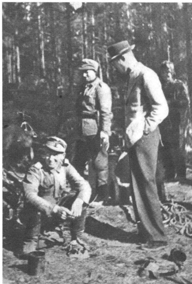
Indro Montanelli in un bosco della Finlandia, a colloquio con alcuni soldati (foto trovata su «Tempo», 216, 22.7.43, p. 30).

fedo il mio incartamento personale depositato al ministero Cultura Popolare. Non sono stato perseguitato, quando non fui più fascista. Non sono stato ufficiale. Sono stato volontario di guerra in Abissinia. Sono stato due volte decorato. Durante il presente conflitto, ho fatto quanto ho potuto per non andare a combattere perché ritengo questa una guerra sbagliata. Però non l'ho sabotata ai danni di chi era obbligato a farla. Sono stato gli ultimi due anni in disparte come giornalista, perché il fascismo non mi consentiva di fare onestamente il mio dovere, e ho fatto soltanto il letterato. Non sono antitedesco, e la prova è che ho sposato una tedesca. Sono antinazista e contro la guerra del nazismo che vuol rendere schiava l'Europa. Non accetto le vostre discriminazioni razziali e non riconosco ai tedeschi nessuna superiorità. Riconosco il loro grande valore militare e tecnico e mi dispiace constatare che l'Europa non può convivere con loro, visto che sarà molto difficile che possa vivere senza di loro. Non ho cospirato né contro il fascismo né contro la guerra. Sono stato contento quando il fascismo è caduto perché questo ci con-