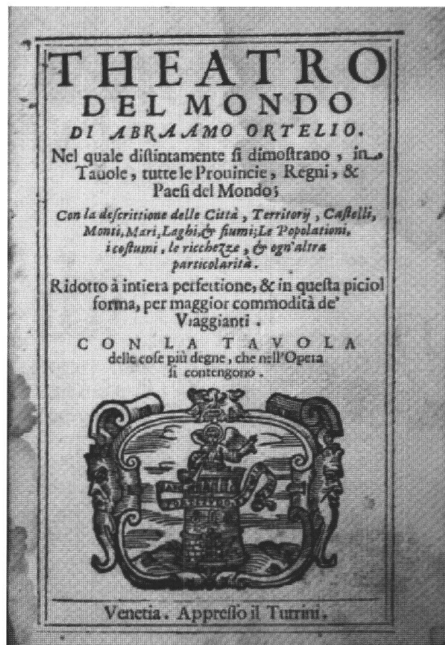
Frontespizio del Theatro del mondo di Abraamo Ortelio (1655)

italiana dei Grigioni fra XVIII e XIX secolo testimoniano anche la traduzione in italiano della Pratica di pietà del puritano inglese Luigi Bayli (Lewis Bayly), stampata a Coira nel 1710, Il cristiano nel continuo esercizio della santa orazione di Gianjacopo de Rota (Lindau 1751), le Preghiere cristiane di Nicolò Clalgüna, pastore a Soglio (Coira 1817), La devozione domestica di Otto Carisch (Coira 1853). Fra le opere in tedesco da ricordare inoltre le Geistliche Erquickstunden di Heinrich Müller, uno dei precursori del pietismo (Francoforte 1717) e Eines Christen Reisen nach der seeligen Ewigkeit del battista inglese John Bunyan (Amburgo 1752; presente anche con un'edizione italiana: Firenze 1883).