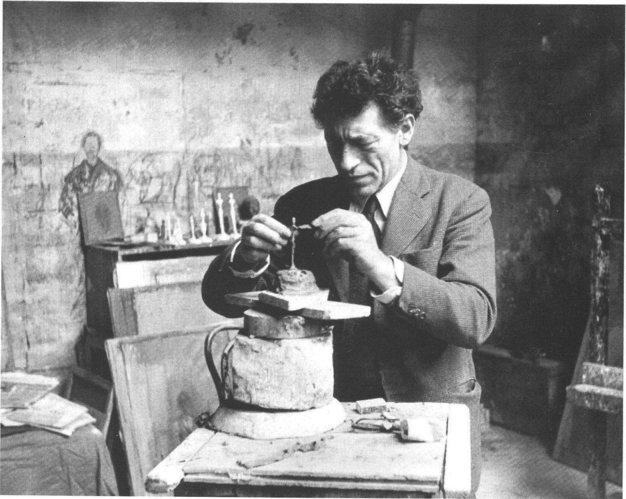
Alberto Giacometti mentre lavora ad una piccola scultura, 1955