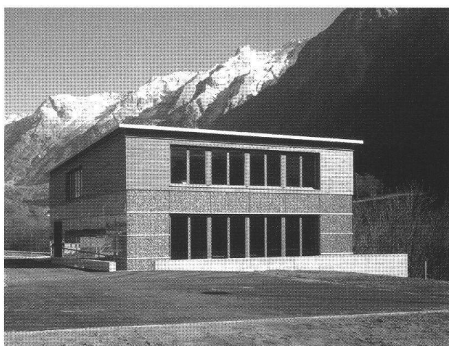
Stampa, il nuovo edificio scolastico costruito nel 2002 su progetto degli architetti Mierla e Kurt Lazzarini.

L'edificio scolastico a Stampa è forse una delle opere migliori di Bruno Giacometti, che lo ha progettato quale elemento en solitaire , ispirandosi alle musc'ne (gli ammassi, più o meno murati, di pietrame nei prati). Il posizionamento e le proporzioni dello stabile, i locali aperti verso sera, l'uso sapiente e ridottissimo dei materiali, ne fanno il punto forte dell'architettura di Giacometti in Bregaglia. Sul palazzo scolastico di Stampa si è intervenuti a due livelli: con lavori di restauro, rispettivamente di semplice manutenzione, e con un ampliamento realizzato alcuni anni orsono.