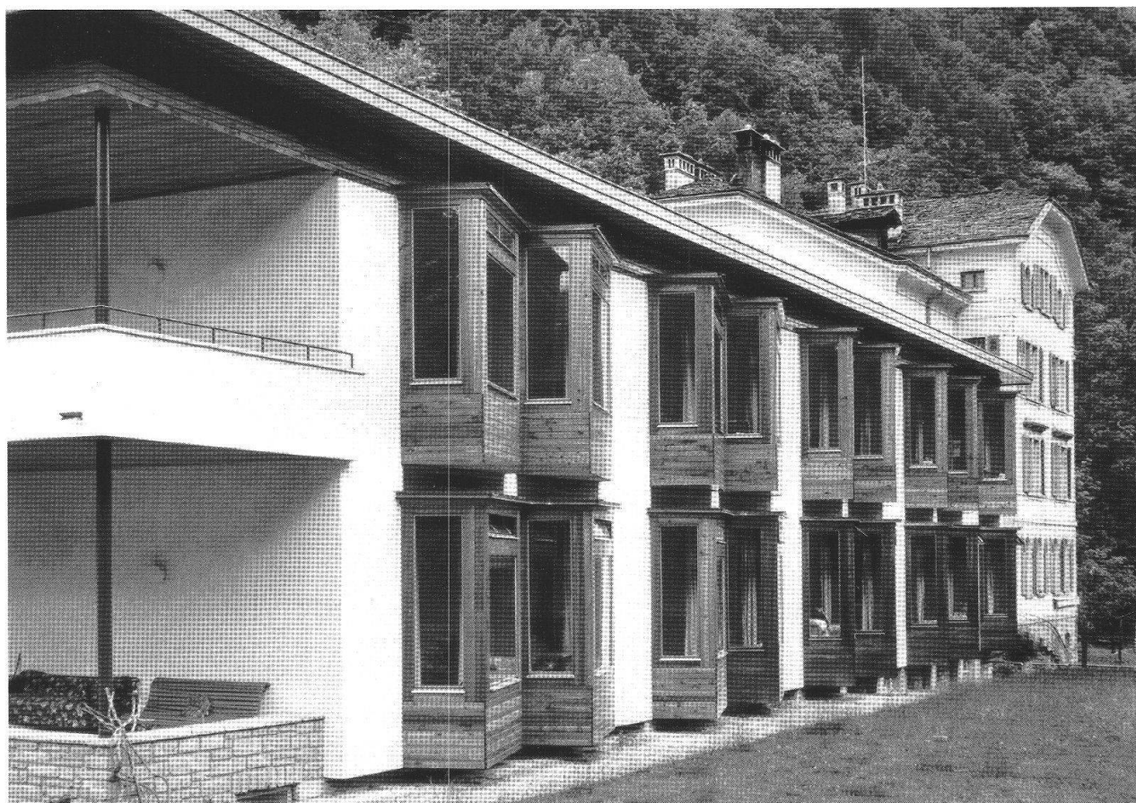
Ospedale a Flin (Soglio), seconda fase dell'ampliamento (1962-63).

Presso l'ospedale-casa di cura della Bregaglia, progettato nel 1902 dall'architetto Ottavio Ganzoni, Bruno Giacometti ha realizzato l'ampliamento che fu intrapreso durante