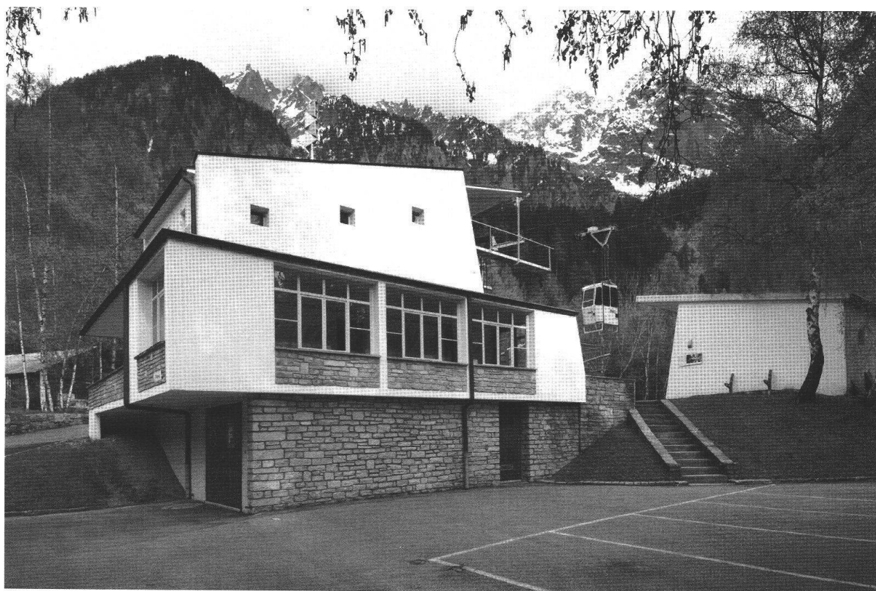
Stazione di partenza della funivia Pranzaira-Albigna.