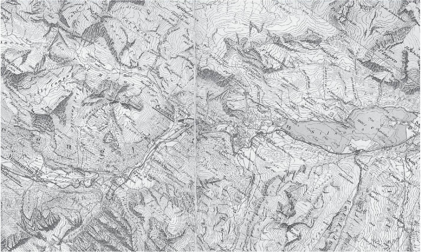
Un estratto del progetto di Philipp Holzmann, Francoforte, 1897. Il progetto fu osteggiato dalla Ferrovia retica, che non voleva rinunciare alla concessione per la ferrovia in Bregaglia (Ciäsa Granda).