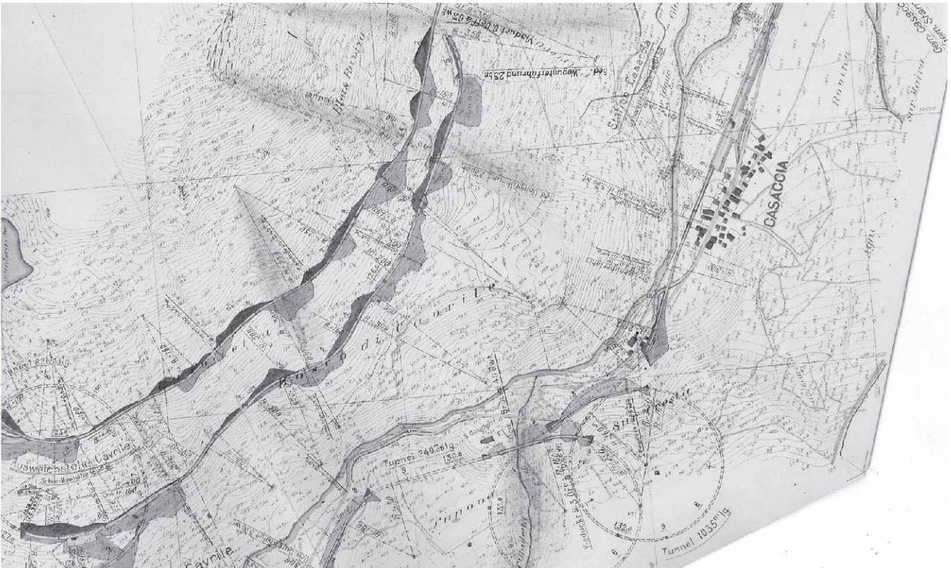
Il tracciato della Bergellerbahn presso Casaccia nei piani della Ferrovia retica del 1918 (Ciäsa Granda).