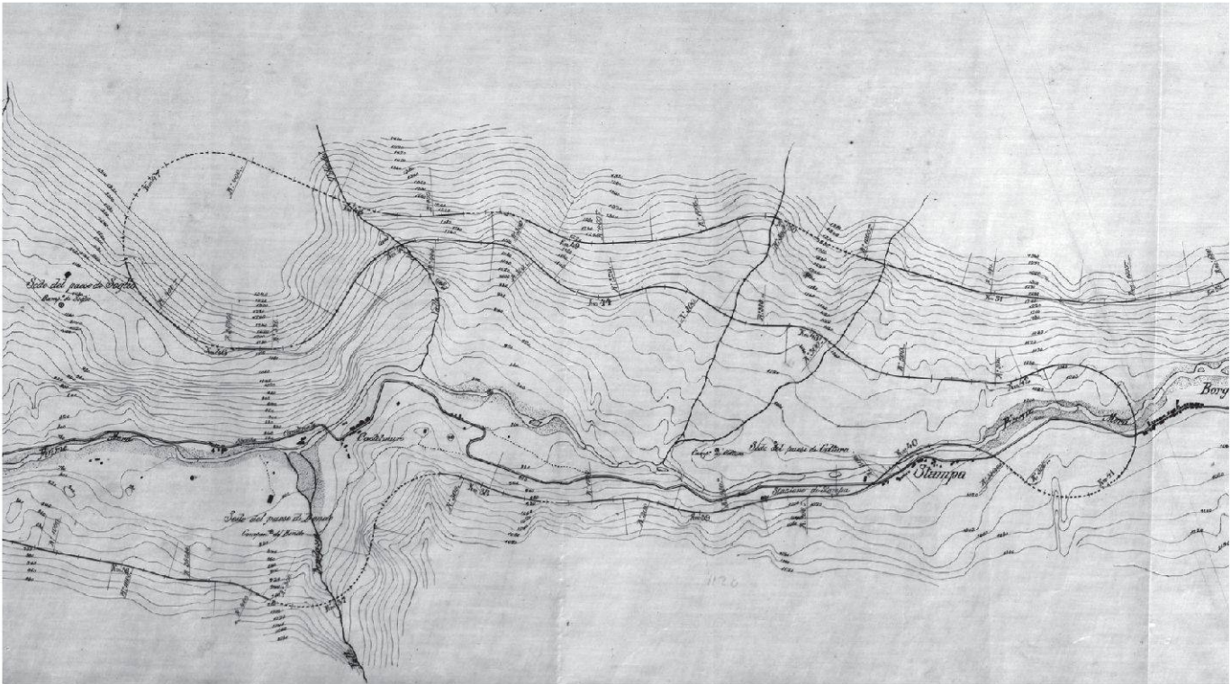
Il tracciato della ferrovia tra Soglio e Stampa nei piani del conte Camille de Renesse, 1882 (collezione privata / Pgi Bregaglia)