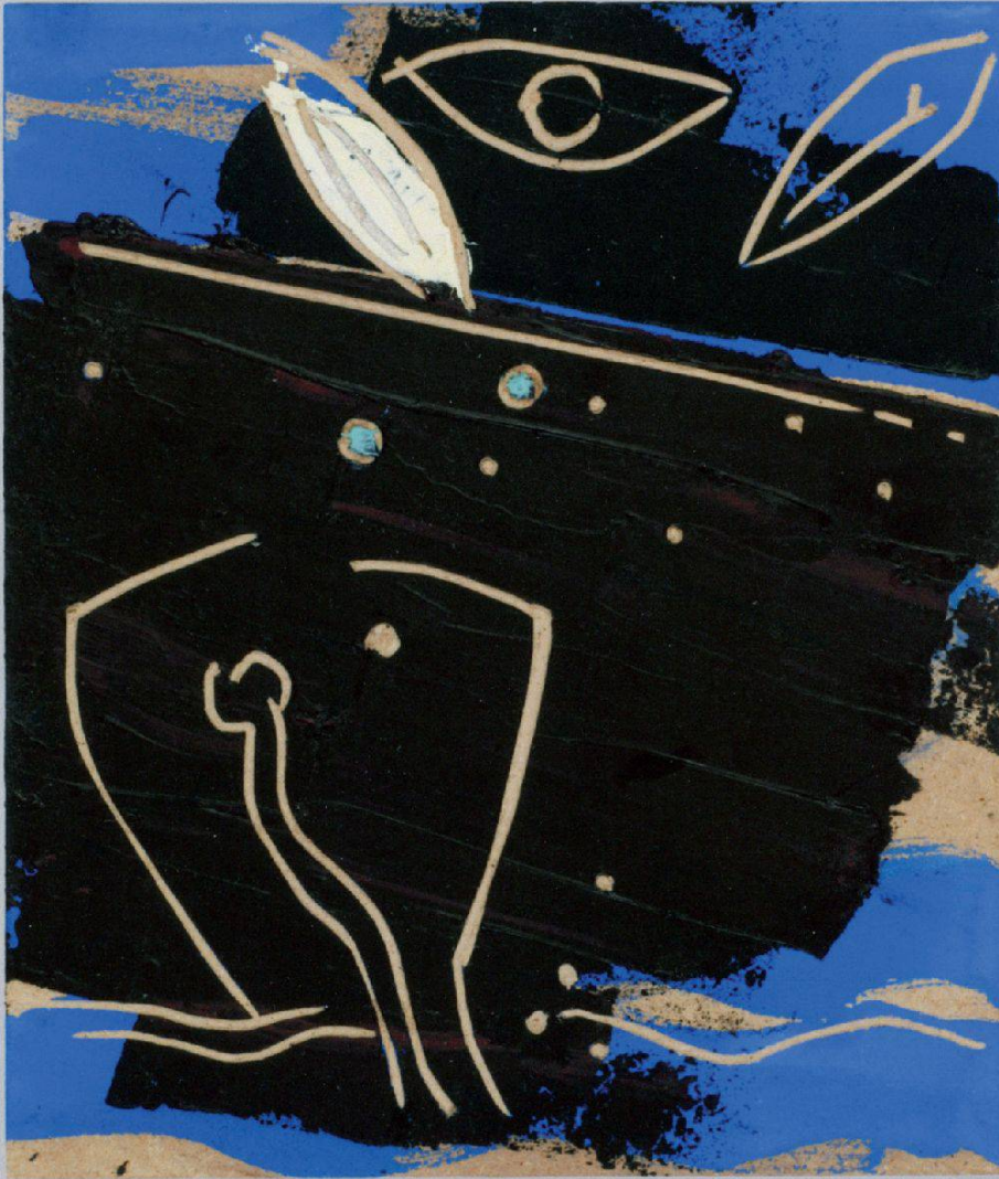
NOTTURNO, 2009, olio e tempera su legno inciso, 23,5x20 cm