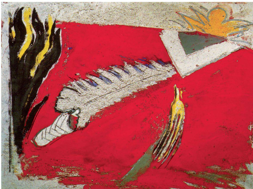
TRAPASSO, 1983, tecnica mista su cartone su legno, 116x151 cm, Museo d'Arte Grigione, Coira

ti, che sono diventati una specie di codice personale, sono il risultato di una continua e attenta osservazione e percezione del mondo visivo, e uno specchio del mio vissuto. Ciò incide sul linguaggio formale, sull'impiego dei mezzi tecnici e non per ultimo sul contenuto e i possibili significati. Detti elementi «liberati» si ricompongono nel quadro in modo spontaneo, intuitivo e autonomo.