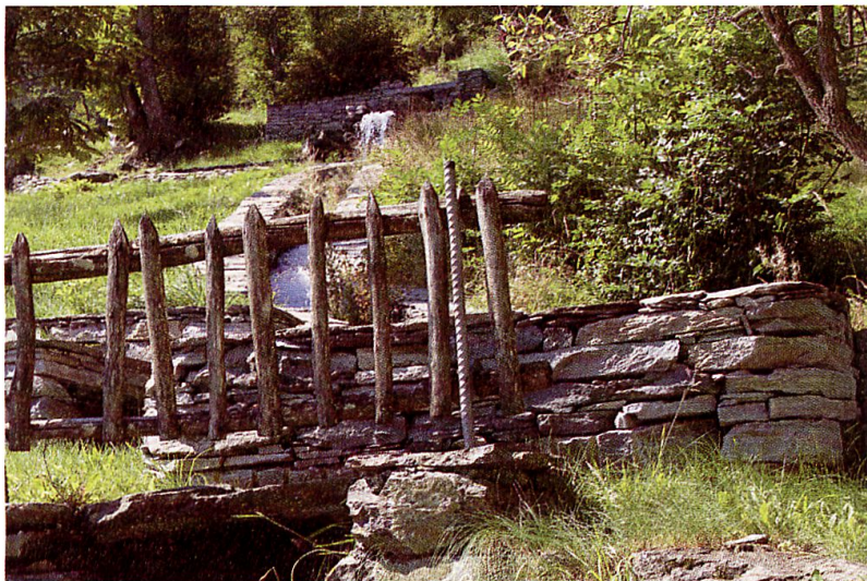
Milena Keller-Gisep Soazza – Ponticello sul canale del mulino