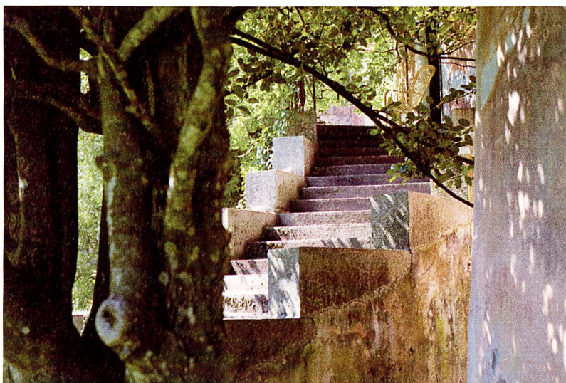
Milena Ehrensperger Scale, Coltura (Palazzo Castelmur)