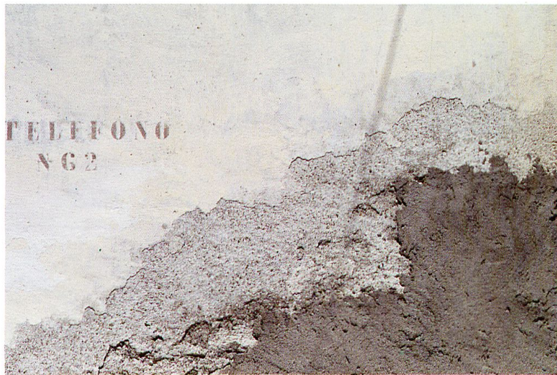
Milena Ehrensperger Muro 1, Isola, telefono N 62