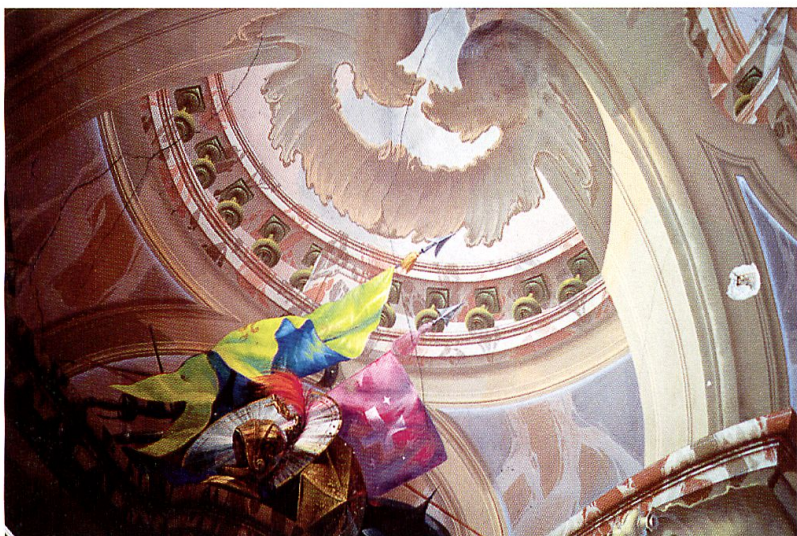
Milena Ehrensperger Muro 5, Coltura (Palazzo Castelmur, bandiere)