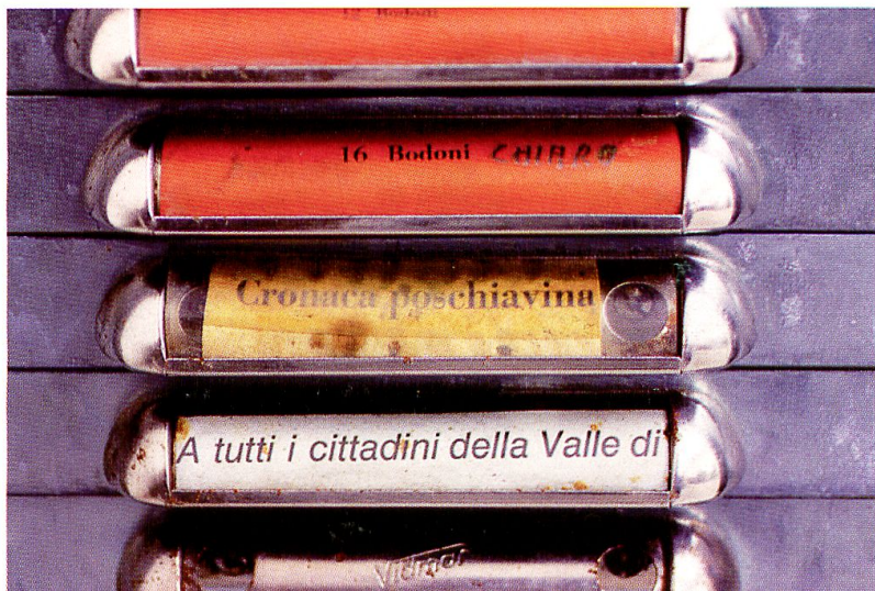
Deborah Zala Archivio matrici per la stampa, Tipografia Menghini, Poschiavo