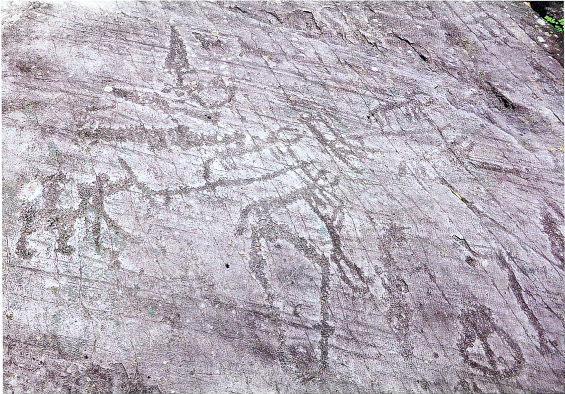
Fig. 2 Riserva Naturale Incisioni Rupestri di Ceto, Cimbergo, Paspardo (Valcamonica), scena di aratura dei campi

Fra i numerosi reperti rinvenuti a fianco di queste vestigia si annoverano diverse centinaia di frammenti ceramici e numerosi artefatti in selce, cristallo di rocca e quarzo.