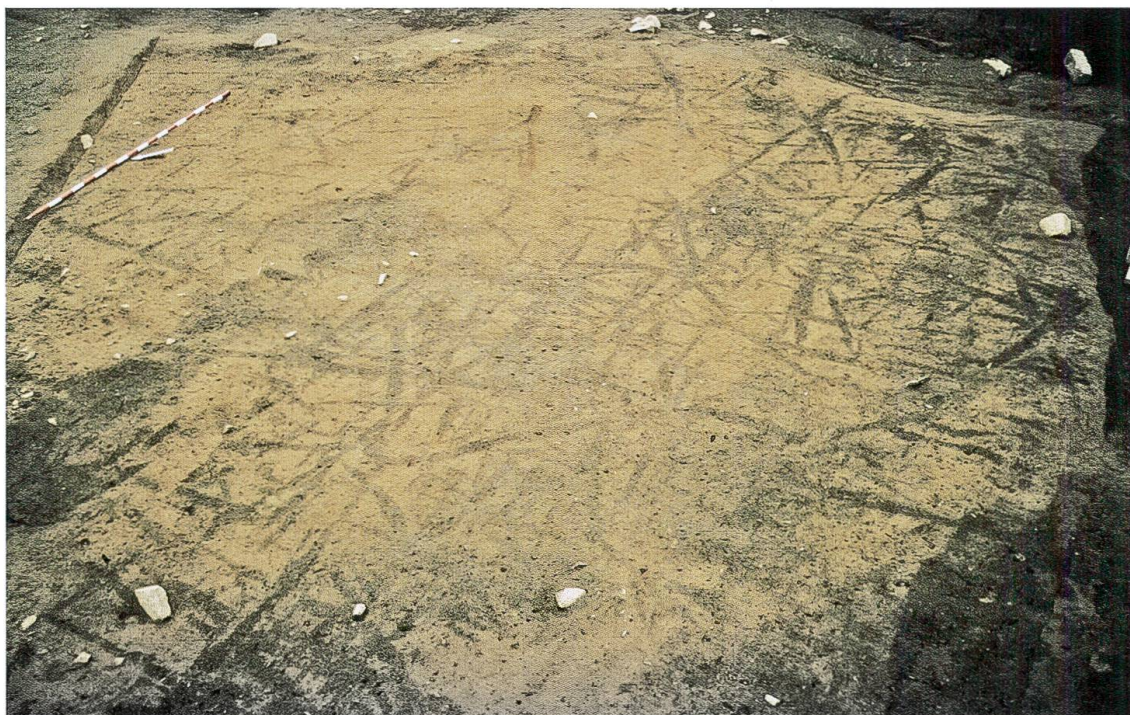
Fig. 1 Castaneda, Pian del Remit, tracce di aratura fossili

Accanto ai solchi lasciati dall'aratro, le indagini archeologiche hanno portato alla luce i resti di un abitato riferibili ad un fondo di capanna e ad un focolare, forse leggermente più antichi dei primi.