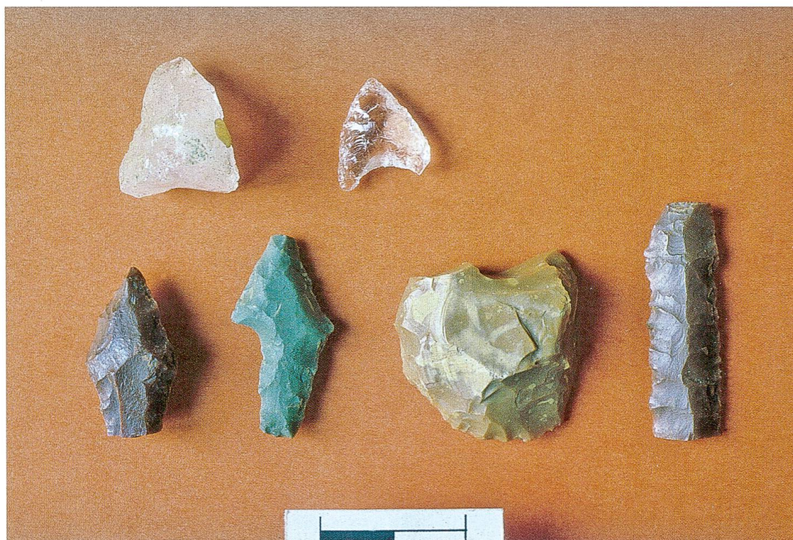
Fig. 3 Castaneda, Pian del Remit, artefatti litici

La pratica della caccia, attestata dalle numerose punte di freccia in pietra rinvenute nel sito calanchino (Fig. 3) interveniva a complemento dell'apporto di carne, assu-