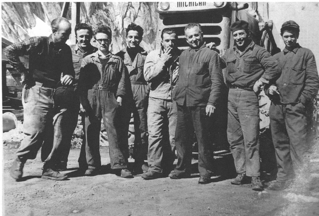
Gruppo di operai sull'Albigna