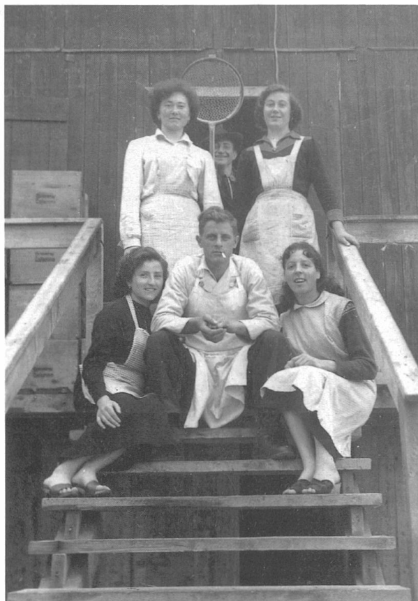
Inservienti sull'Albigna, estate 1956

in più, se stavano lì a chiacchierare, anche a ballare. Non li ho mai visti né sentiti urlare né litigare. No no, c'era sempre su una bella tranquillità.