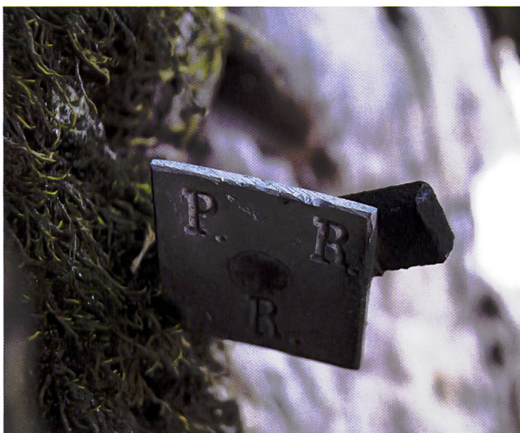
Alcune piante nel Pian de la Madona di Roveredo sono ancora oggi contrassegnate con una targhetta metallica infissa nel tronco a circa quattro metri d'altezza.

Come già affermato, lo jus plantandi costituisce una vantaggiosa opportunità per gestire a fondo le risorse ambientali, sia per i singoli vicini di una comunità sia anche per altre comunità, le quali possono avvalersene su territori di comunità geograficamente vicine ma anche assai distanti. Scrive Broggin: