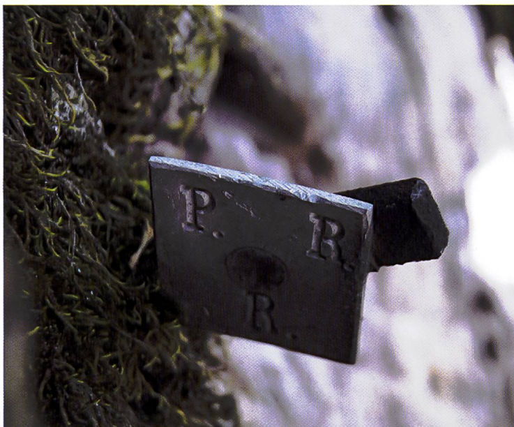
Alcune piante nel Pian de la Madona di Roveredo sono ancora oggi contrassegnate con una targhetta metallica infissa nel tronco a circa quattro metri d'altezza.

Come già affermato, lo jus plantandi costituisce una vantaggiosa opportunità per gestire a fondo le risorse ambientali, sia per i singoli vicini di una comunità sia anche per altre comunità, le quali possono avvalersene su territori di comunità geograficamente vicine ma anche assai distanti. Scrive Broggin: