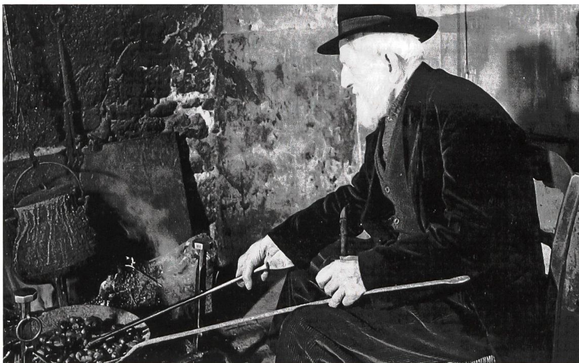
Un anziano signore cuoce le castagne sul focolare (immagine tratta da un calendario ticinese)

Per quanto riguarda la Mesolcina, nei protocolli notarili del tardo Quattrocento 5 questo scambio ricorre frequentemente, così come in generale a livello documentario, in particolare nei contratti agrari. 6 Già negli statuti di Leggia del 1380 i primi sei articoli limitano fortemente il taglio dei castagni (testimonianza indiretta di una certa diffusione della vite), mentre gli articoli seguenti scoraggiano i danni arrecati dagli animali domestici e il furto dei frutti. 7 La coltivazione del castagno è diffusa fino al promontorio del castello di Mesocco, mentre in Calanca la soglia di crescita