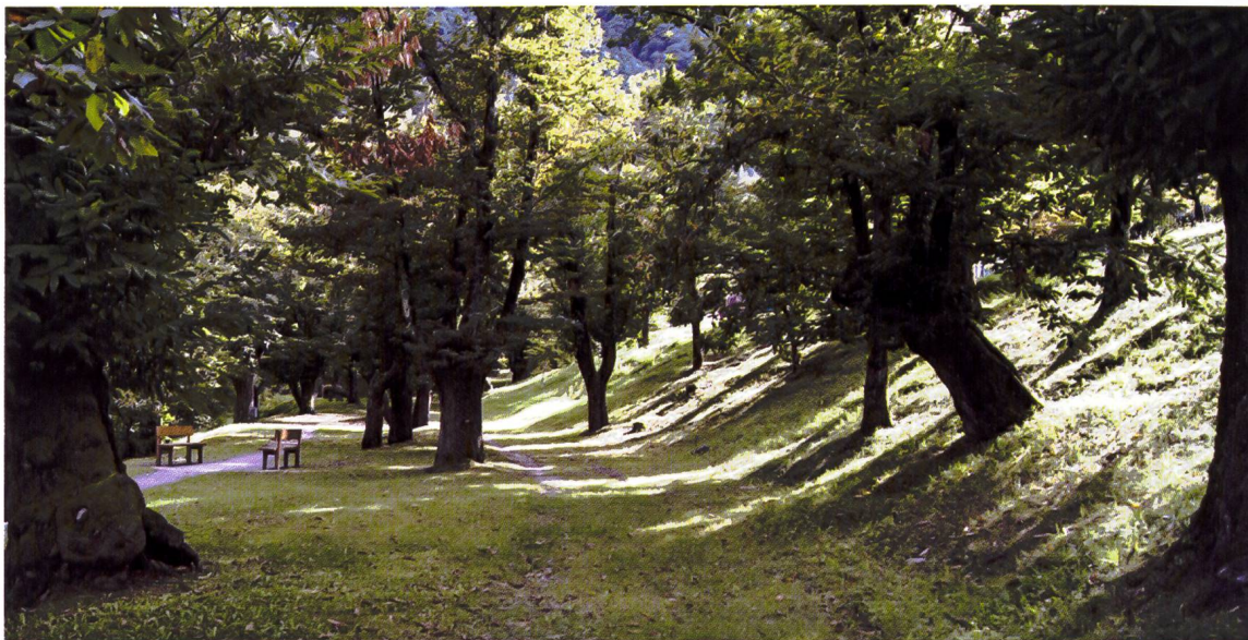
Uno scorcio del Pian de la Madona a Roveredo, terreno patriziale con alberi assorbiti nel patrimonio comunale a partire dalla fine degli anni '70 del secolo scorso.

Quattro sono le zone del paese in cui lo si esercita intensamente a partire dal Basso Medioevo (caratterizzato da un forte aumento demografico): la zona sommitale di