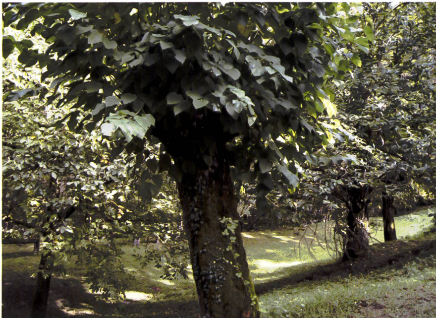
Il Pian de la Madona a Roveredo, il più grande terreno in cui si esercitava lo jus plantandi. Degno di nota è che accanto ai castagni (a destra) si trovano sporadicamente anche noci (a sinistra) e persino gelsi (in dialetto morón, al centro).