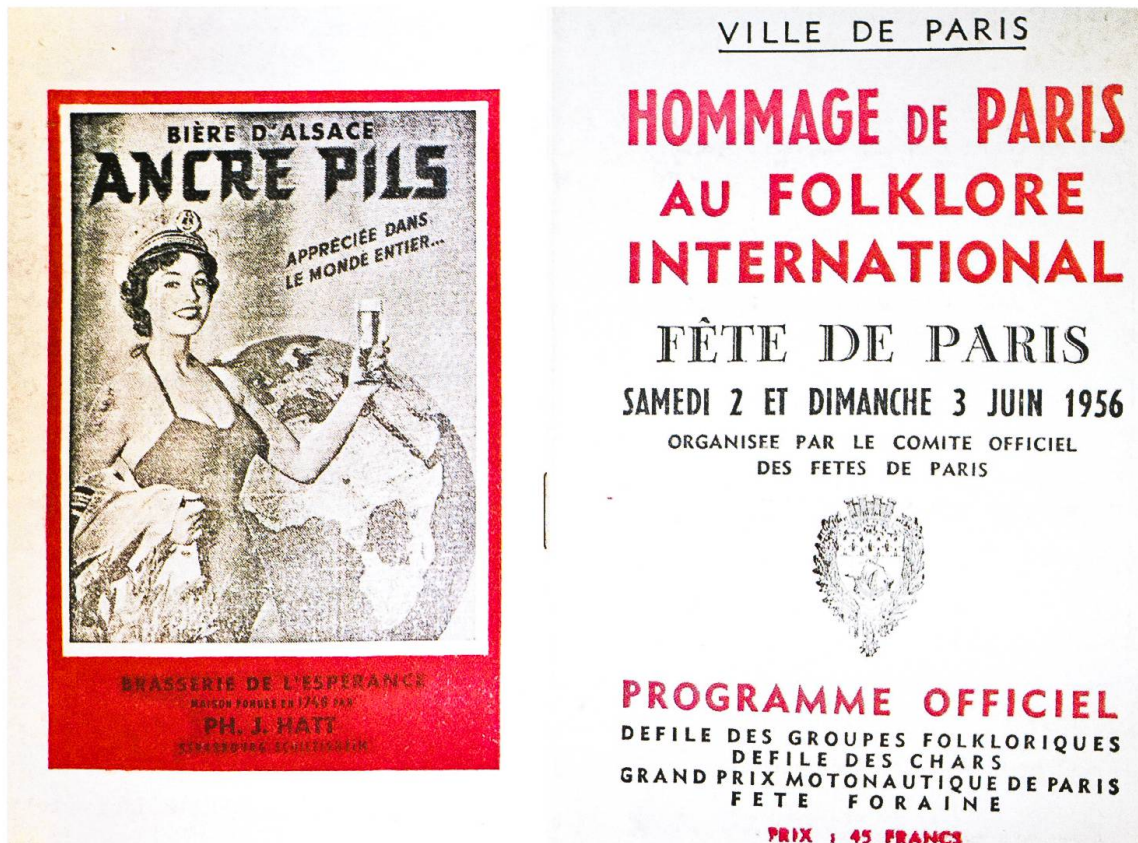
Programma del Grand gala du folklore international tenutosi a Parigi nel 1956 (Archivio di Stato dei Grigioni, Fondo Remigio Nussio)

Nel 1957 morì mio padre e il tempo per scrivere le musiche per pianoforte venne a mancare; le melodie le dovevo conservare in testa. Mettevo su carta solo le canzoni popolari che venivano poi cantate dai vari cori [...]. Prendevo il primo foglio che mi capitava sottomano e sul retro tracciavo un pentagramma e annotavo alcune note. Così mi rimaneva il tema. Poi elaboravo il testo. Il tempo per la musica era effettivamente poco ma quando una cosa piace il tempo lo si trova sempre. Un certo periodo lavoravo fino a 16 ore al giorno senza stancarmi. Avevo la fisarmonica in ufficio; alle volte mi capitava di sostare un attimo e fare una suonatina. 41