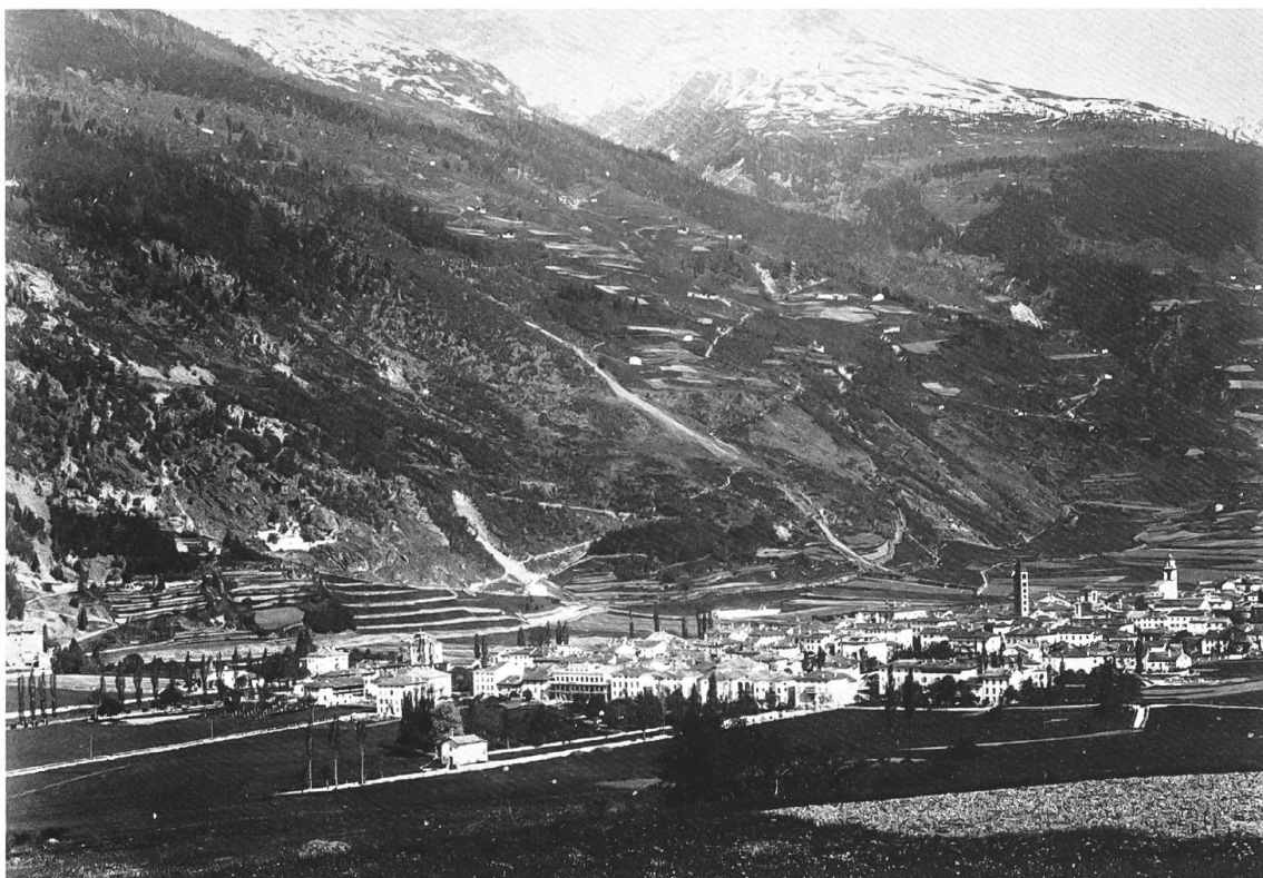
Panoramica da San Sisto nel 1891. Sul versante opposto si vedono il Crott, gli «Ortini», i runchetti di Spoltrio e la chiesetta di San Pietro attornata da rocce e pietraie, nonché il sentiero che sale ai Planasci e continua in direzione Miravalle.

Eppure quanto scarsa frequenza! L'erba che copre il sentiero, il muschio che riveste i sedili, ci dicono purtroppo che la nostra valle, tanto bella e pittoresca, non è apprezzata come si conviene da' suoi stessi abitatori. 92