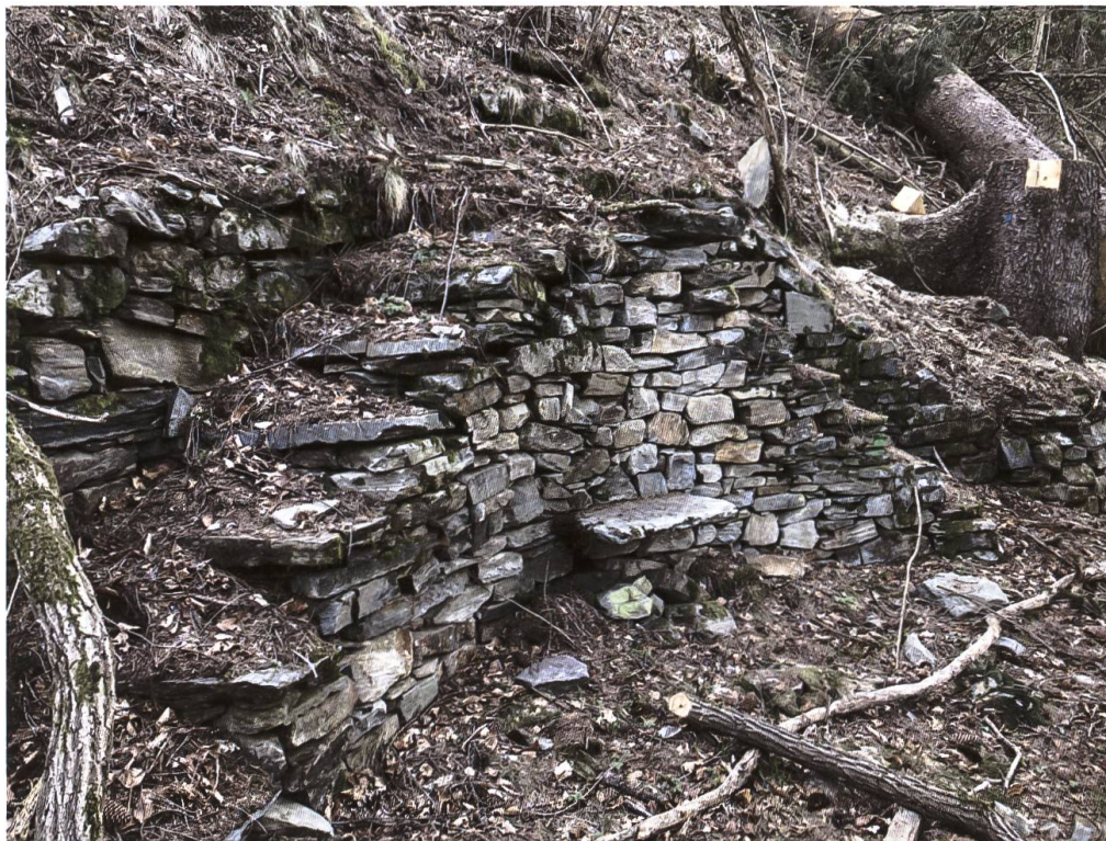
Lungo il sentiero dal Crott ai Pradei.