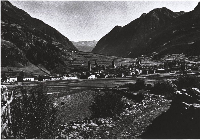
Il Borgo visto da Resena, a fine Ottocento. Tra le attività annuali della Società del Risveglio vi era il riordino e la pulizia dei sentieri realizzati. Guardando alla cura del tracciato e alla vista panoramica, potrebbe essere forse anche questa una sua realizzazione?