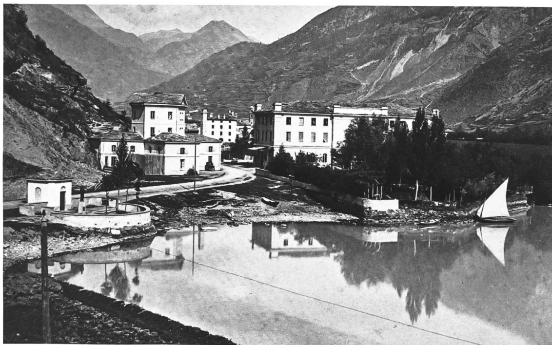
Albergo Bagni Le Prese, anno 1880. A sinistra si noti la sponda pressoché spoglia, a destra le montagne ampiamente disboscate.

E prima prova lo siano i nostri concittadini, che da lontane contrade rivisitano con piacere questo nostro bel paese e vi ricuperano le forze logorate all'estero nel disimpegno delle loro faticose occupazioni. 43