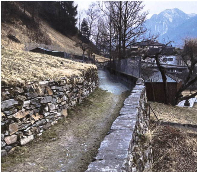
Il sentiero del cimitero protestante fu riattato dalla Società del Risveglio nel 1894.