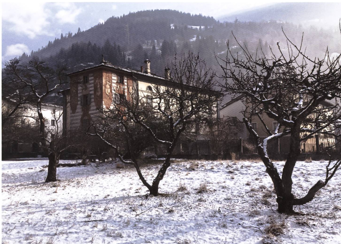
Il bröl della Casa Matossi-Lendi di Poschiavo, in inverno.

Questi erano gli obiettivi della Società di frutticoltura, che fu però sciolta già nel 1868. Il suo esempio sarebbe tuttavia stato ripreso dalla Società per orti e planticoltura (1875-1877), quindi dalla Società Agricola di Poschiavo 32 e dal Club di frutticoltura fondato nel 1893, 33 nonché dalla Società del Risveglio che qui maggiormente ci interessa.