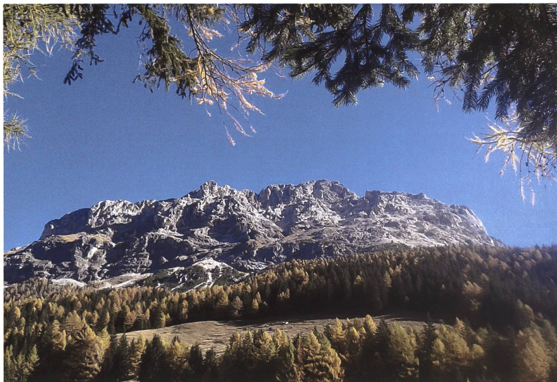
Il pascolo di Risvegliu, fotografato da Cansumé.

inoltre ancora oggi il nome di un'area adibita al pascolo all'altitudine di circa 1'700 m.s.l.m. nella zona di Cansumé, ai piedi del Sassalbo. 142