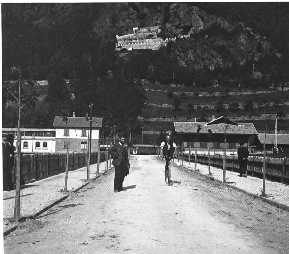
Anno 1910. Scorcio dal Viale della Stazione in cui si vedono i terrazzamenti con alcune piantagioni e gli «Ortini».