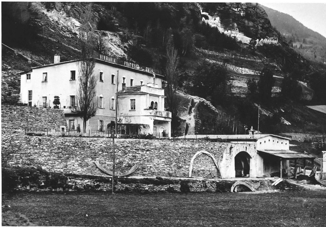
Il Crott con il birrificio dei fratelli Zala. Alcune aree della costa di Spoltrio devono ancora essere sistemate.

Si trattò dunque di un lavoro di dimensioni notevoli, oggi purtroppo scomparso con l'avanzamento del bosco naturale. Possiamo però ancora vedere le diverse cinte di muro a secco che si trovano a monte della stazione ferroviaria e nei pressi della chiesa di San Pietro. Altresì possiamo camminare sul sentiero ancora intatto che dal Crott porta alla vasca dei Pradei, ammirando lungo il percorso le particolari costruzioni murarie di pietra adibite come aree di riposo nella frescura del bosco.