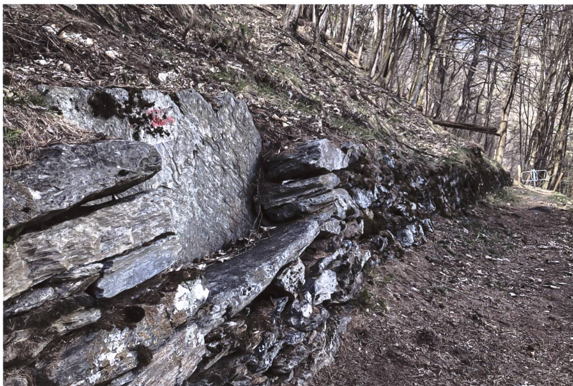
Un sedile in pietra lungo il sentiero che porta a Miravalle.

In anni recenti, per opera di una rinata Società del Risveglio, è stato presentato un progetto (intitolato «Il giro dei secoli») per valorizzare nuovamente la zona, riordinando i sentieri da San Pietro fino al Castellasc (le già citate rovine), a monte di Miravalle, e realizzando una lunga scalinata di pietra nell'area di Roncascio. 100