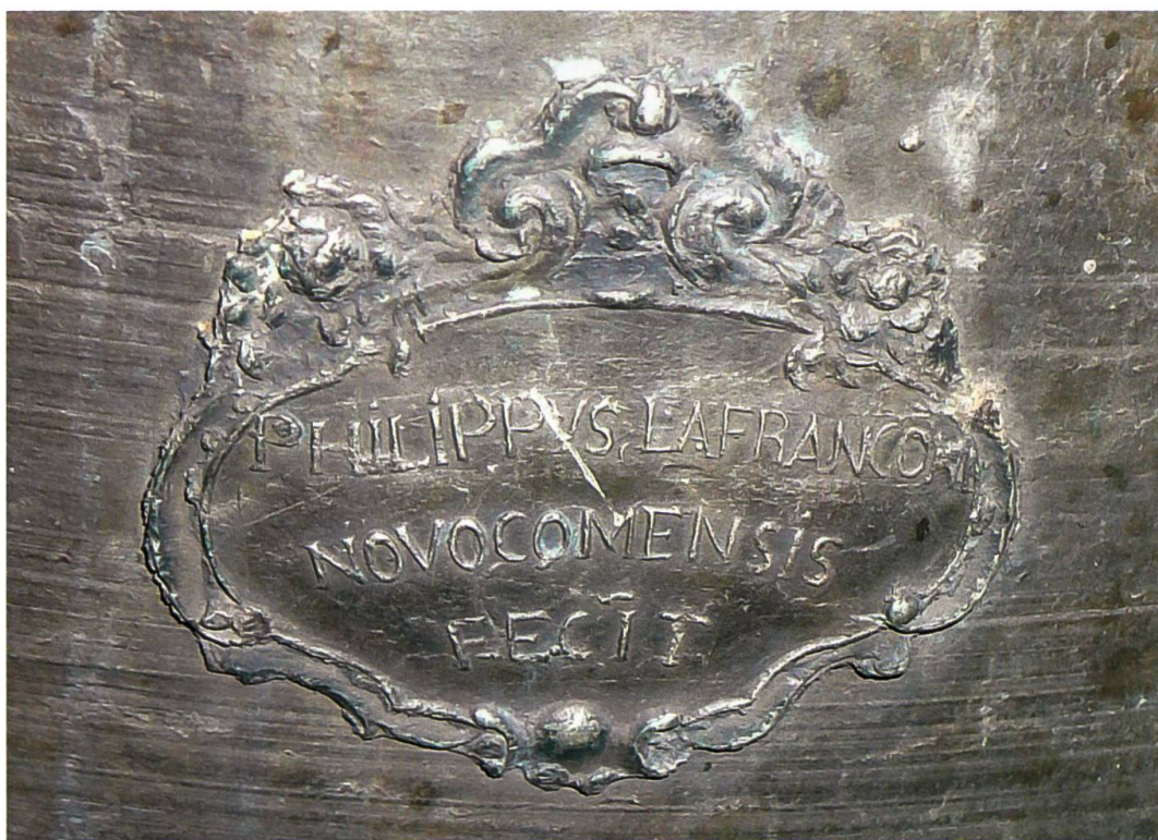
Bondo, chiesa di San Martino, seconda campana (Lafranconi, 1785): stemma del fonditore