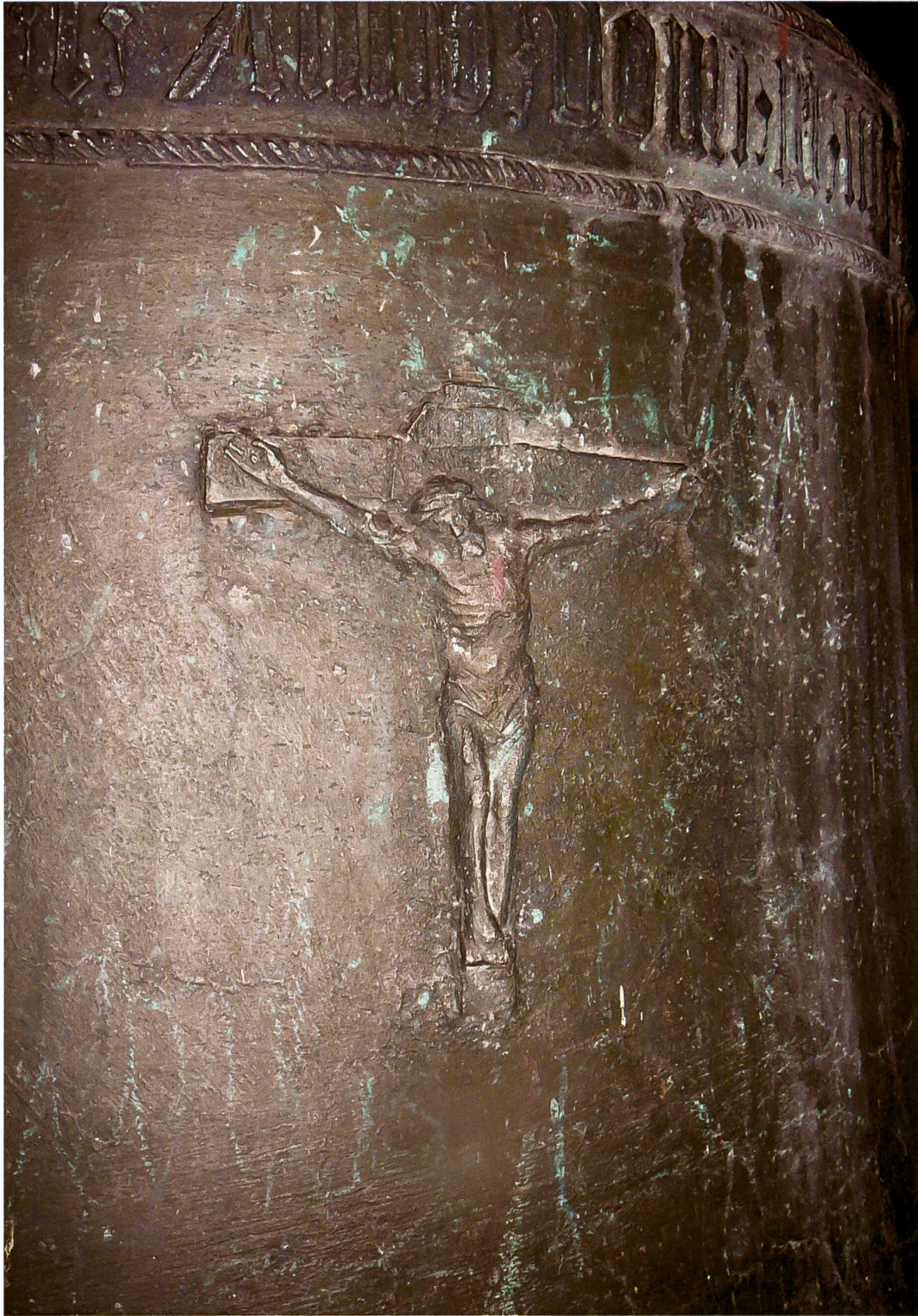
Promontogno, chiesa di Nossa Dona, campana (Ulrich Stubenvoll, 1491): dettaglio della figura del Crocifisso

La campana minore di San Pietro a Coltura, anch'essa datata e non firmata, è di pochi anni più giovane della precedente (1498), ma presenta caratteristiche assai diverse, che rinviano a un fonditore d'area francese.