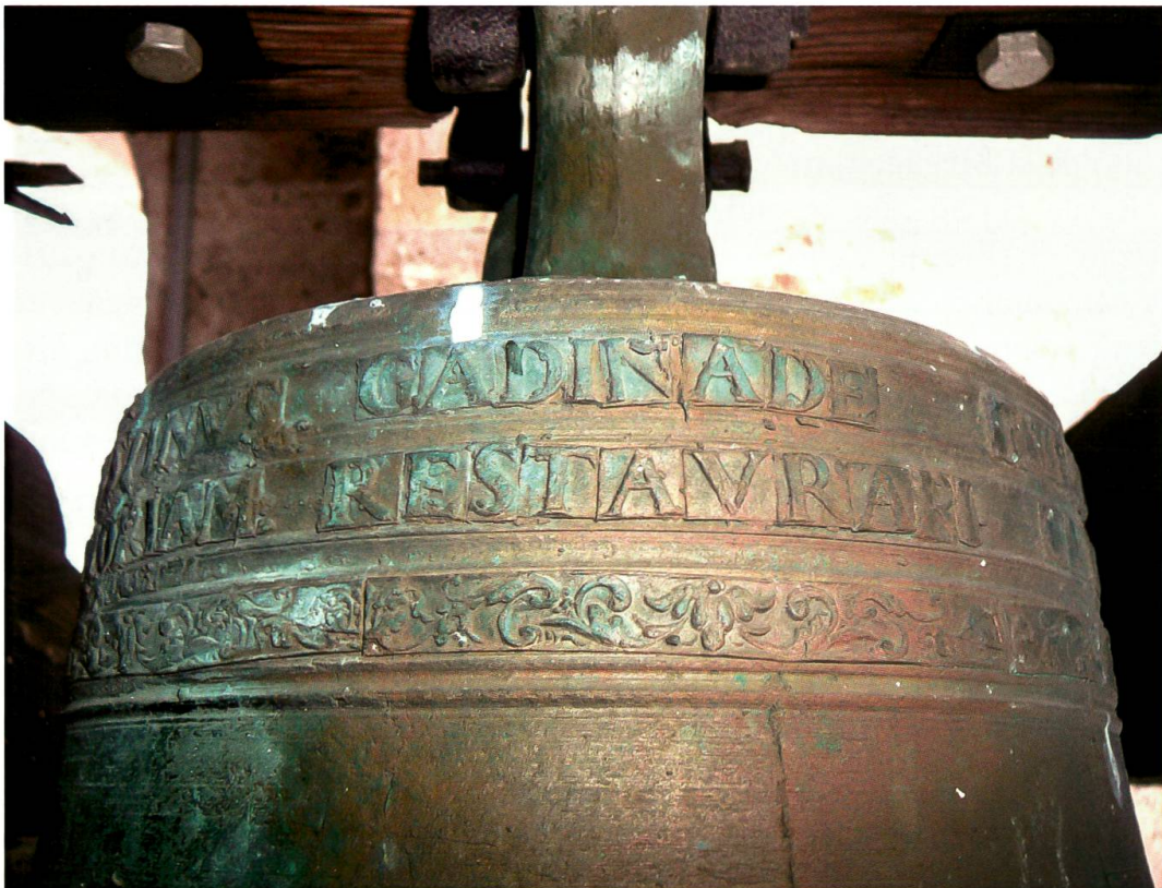
Coltura, chiesa di San Pietro, «campana da morto» (anonimo, 1650): dettaglio dell’iscrizione

da un’asola di bronzo trilobata, a forma di trifoglio. Sulla spalla della campana è presente un duplice anello per l’iscrizione latina, i cui caratteri sono composti con la capitale romana, e che tradotta dice: “Il nobile signor pretore Agostino Gadina de Torriani si occupò di restaurare questa campanella ad eterna memoria della cosa nell’anno 1650”. L’iscrizione è interessante perché ci fornisce almeno due informazioni: la prima è il nome del pretore dell’epoca, Agostino Gadina de Torriani (1604-1680), che promosse la realizzazione della campana; la seconda notizia è che la stessa campana non rappresenta un nuovo manufatto, ma è una rifusione di un altro bronzo più antico, al riguardo del quale non abbiamo notizie. Al di sotto dell’iscrizione è collocato un semplice fregio ornamentale fitomorfo. Lungo lo svasamento della campana troviamo impressa l’immagine del Crocifisso, poggiante sopra tre linee decorative. Altre due linee semplici sono collocate tra il punto di massimo spessore e il labbro inferiore della campana.