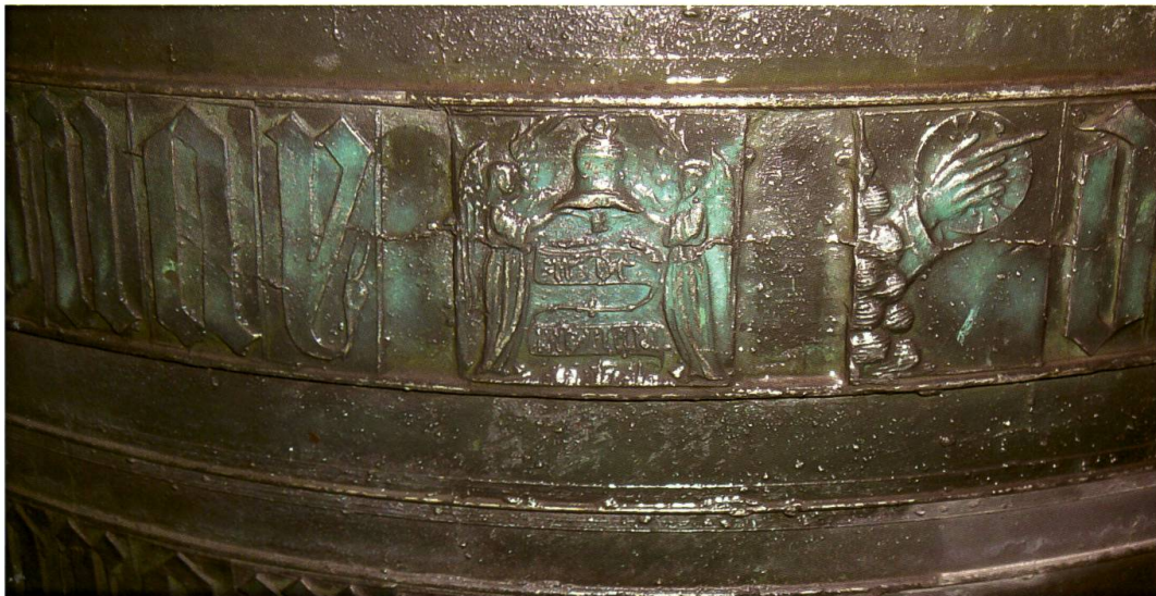
Bardo, chiesa di San Martino, campana maggiore (Jean de Maulain, 1523): dettaglio dell’iscrizione con lo stemma del fonditore