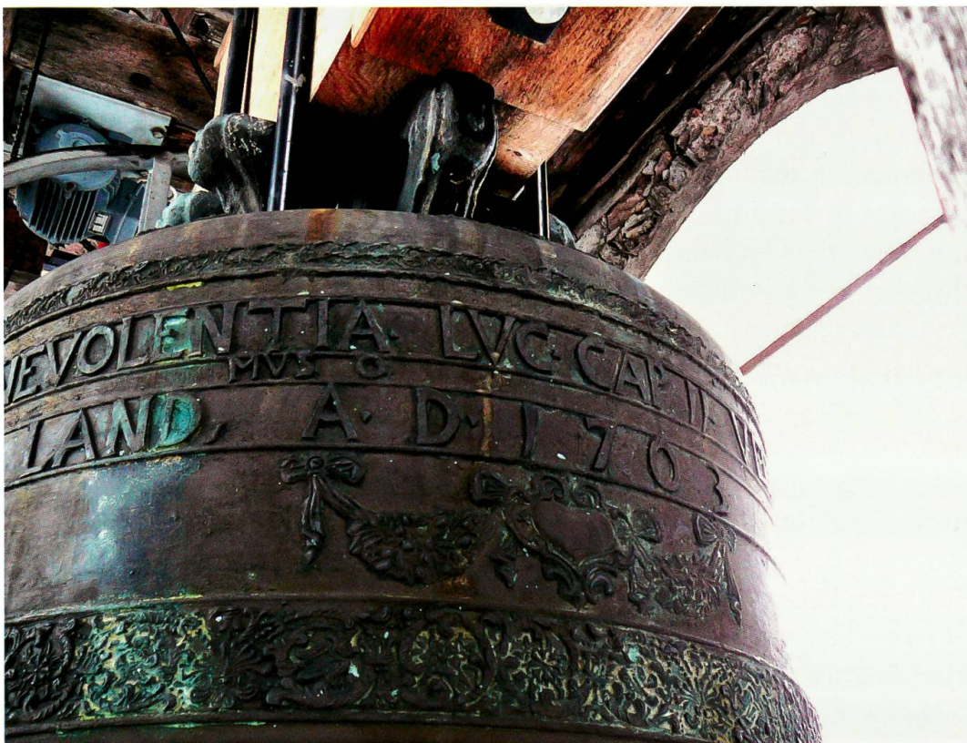
Soglio, chiesa di San Lorenzo, campana maggiore (Ballabeni e Giboni, 1703): dettaglio della decorazione

Nel 1717 vengono fuse ben altre quattro campane destinate a tre chiese della valle; si tratta della più grande fusione di bronzi attualmente documentata in Bregaglia. Artefici di questa impresa sono i fratelli Francesco e Gaetano Comolli di Como, figli di quel Nicolò che quarant'anni prima aveva fuso le campane di Castasegna. Una di queste campane è la maggiore della chiesa di San Pietro di Coltura (dm. alla bocca: 105,5 cm). Il bronzo presenta la corona formata da sei maniglie disposte ortogonalmente a croce (4+2), con anello centrale per l'aggancio al ceppo di sostegno. Sulla spalla è presente l'anello con l'iscrizione. Al di sopra troviamo un fregio ornamentale identico a quello riscontrabile sulle due campane di Castasegna. All'incirca alla metà della campana corre una grossa fascia ornamentale, frutto del medesimo elemento decorativo accostato più volte fino a cingere l'intera circonferenza, che rappresenta una testa di cherubino dalla quale si diramano capricciose volute vegetali. Al di sopra di questa fascia troviamo altri decori vegetali: quattro foglie di acanto, equidistanti e con la punta rivolta verso l'alto, intervallate da altrettante foglie di salvia, anch'esse equidistanti e con la punta rivolta all'insù; al di sotto della fascia decorativa si trovano disposte altre quattro foglie d'acanto, questa volta pendenti, collocate esattamente in corrispondenza di quelle presenti nel registro superiore, in modo tale da creare un effetto