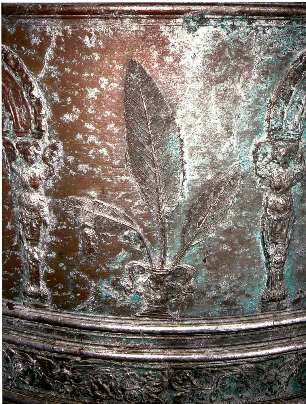
Vicosoprano, chiesa di San Cassiano, campana maggiore (Crespi, 1754): dettaglio degli elementi vegetali