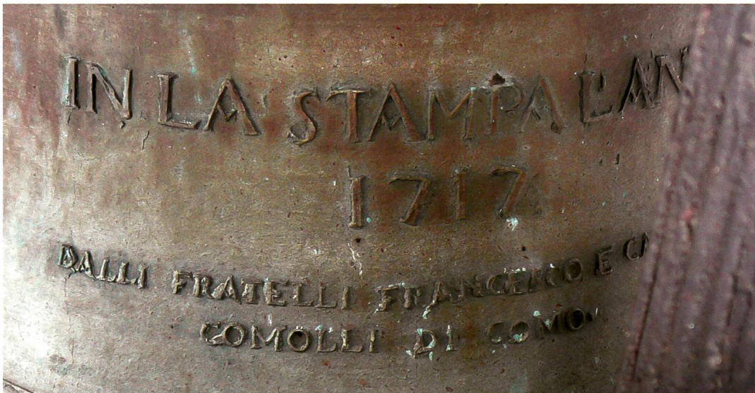
Borgonovo, chiesa di San Giorgio, campana maggiore (Comolli, 1717): dettaglio dell'iscrizione