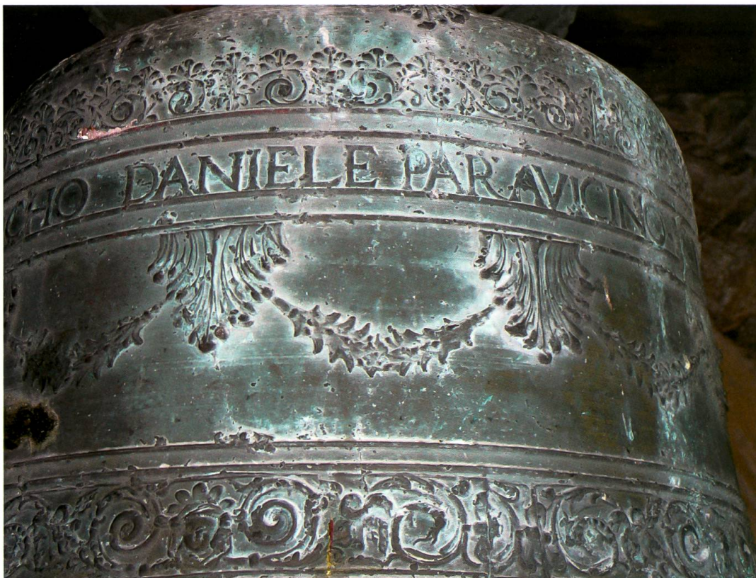
Castasegna, chiesa di Santa Trinità, campana minore (Comolli, 1677): dettaglio della decorazione