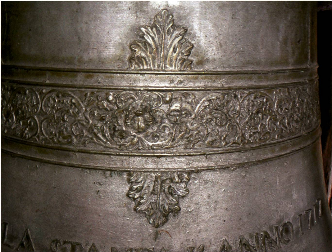
Coltura, chiesa di San Pietro, campana maggiore (Comolli, 1717): dettaglio della decorazione