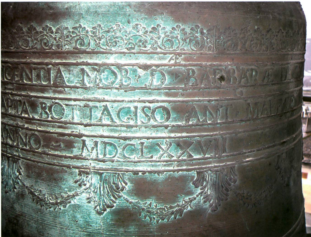
Castasegna, chiesa di Santa Trinità, campana maggiore (Comolli, 1677): dettaglio delle iscrizioni