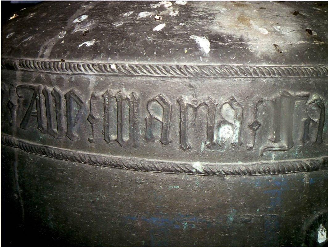
Promontogno, chiesa di Nossa Dona, campana (Ulrich Stubenvoll, 1491): dettaglio dell'iscrizione della campana

quelle di un fonditore di area tedesca. Ulrico da Coira sembra poter essere identificato con Ulrich Stubenvoll, che partecipò come cannoniere nello schieramento grigione alla battaglia della Calva nel 1499. 20