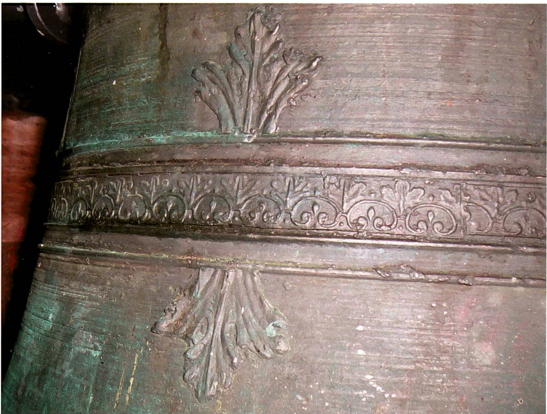
Bondo, chiesa di San Martino, «campana da morto» (Comolli, 1717): dettaglio della decorazione