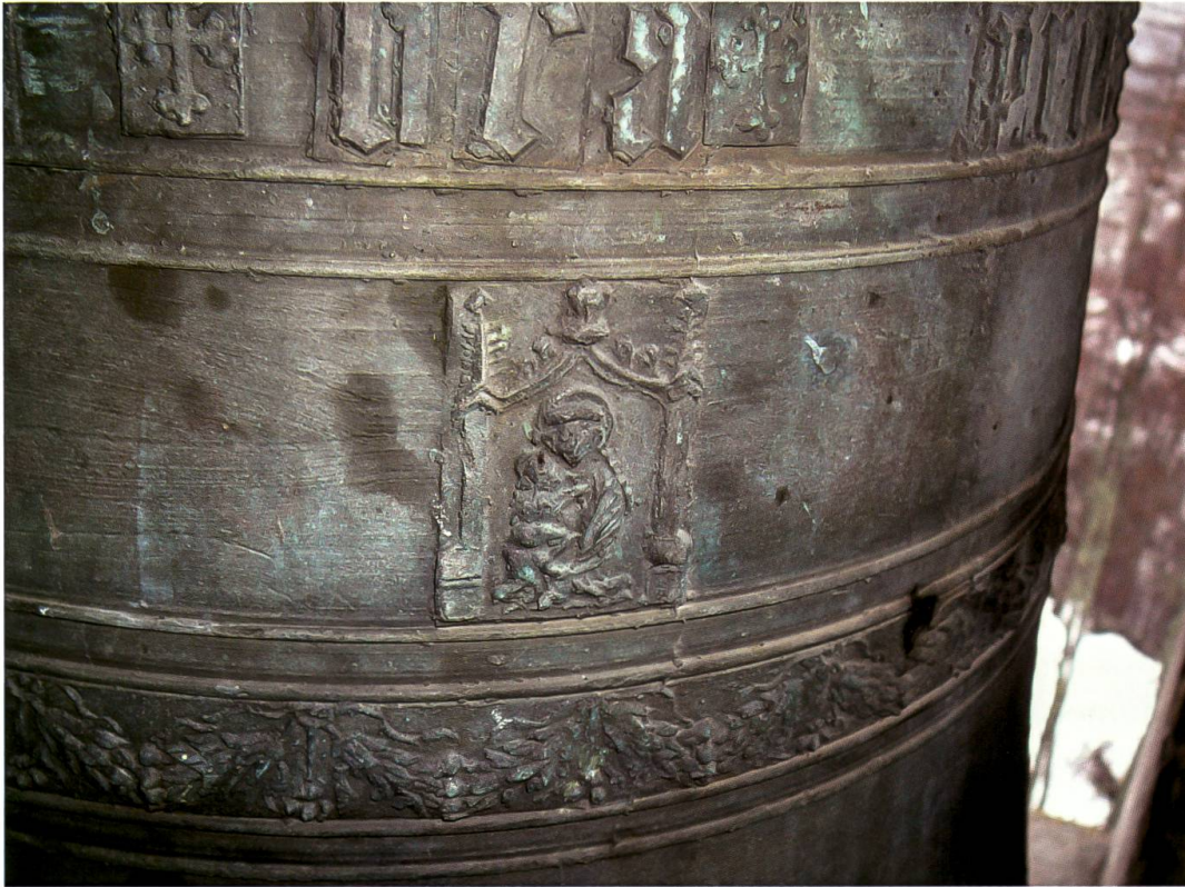
Coltura, chiesa di San Pietro, seconda campana (anonimo francese, 1498): dettaglio della figura della Madonna con il Bambino

chiesa), riportano gli stessi caratteri alfabetici e lo stesso cristogramma; in entrambi i casi si tratta di campane di dimensioni contenute e che non recano figure sacre. 22