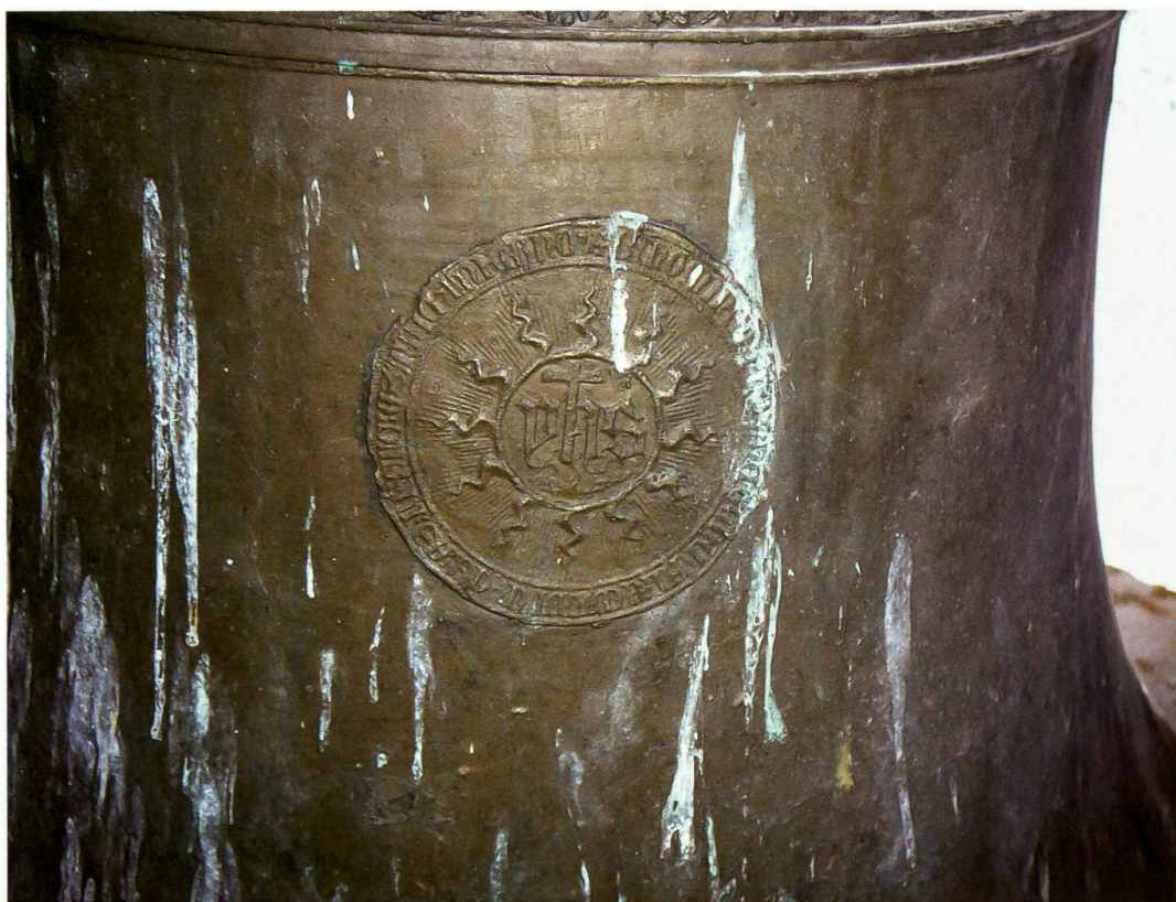
Coltura, chiesa di San Pietro, seconda campana (anonimo francese, 1498): dettaglio del cristogramma di san Bernardino da Siena