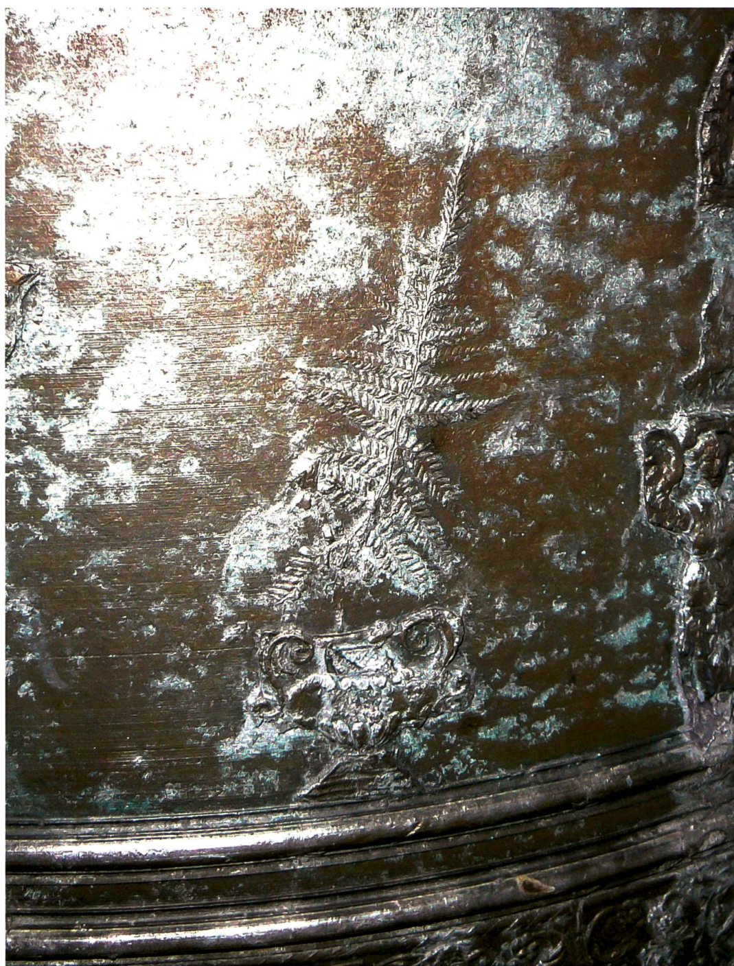
Vicosoprano, chiesa di San Cassiano, campana maggiore (Crespi, 1754): dettaglio degli elementi vegetali