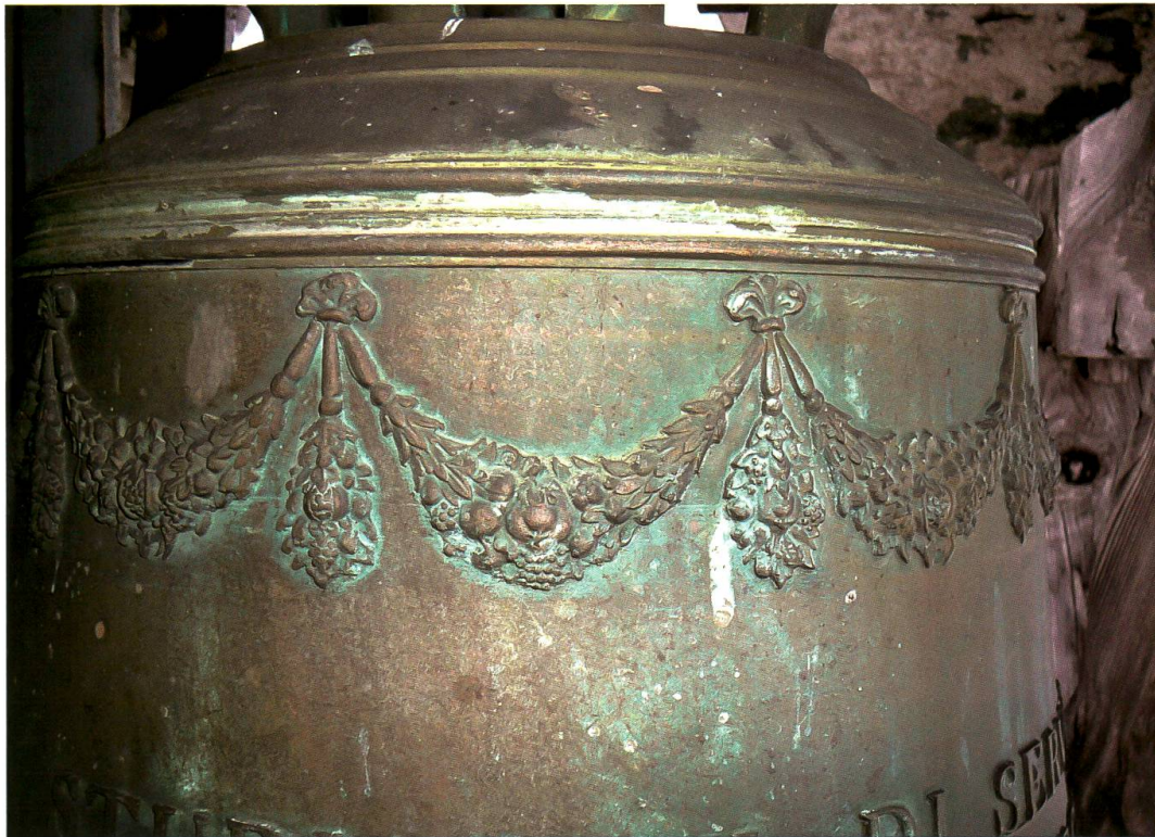
Casaccia, chiesa di San Giovanni, campana minore (Theus, 1871): dettaglio della decorazione