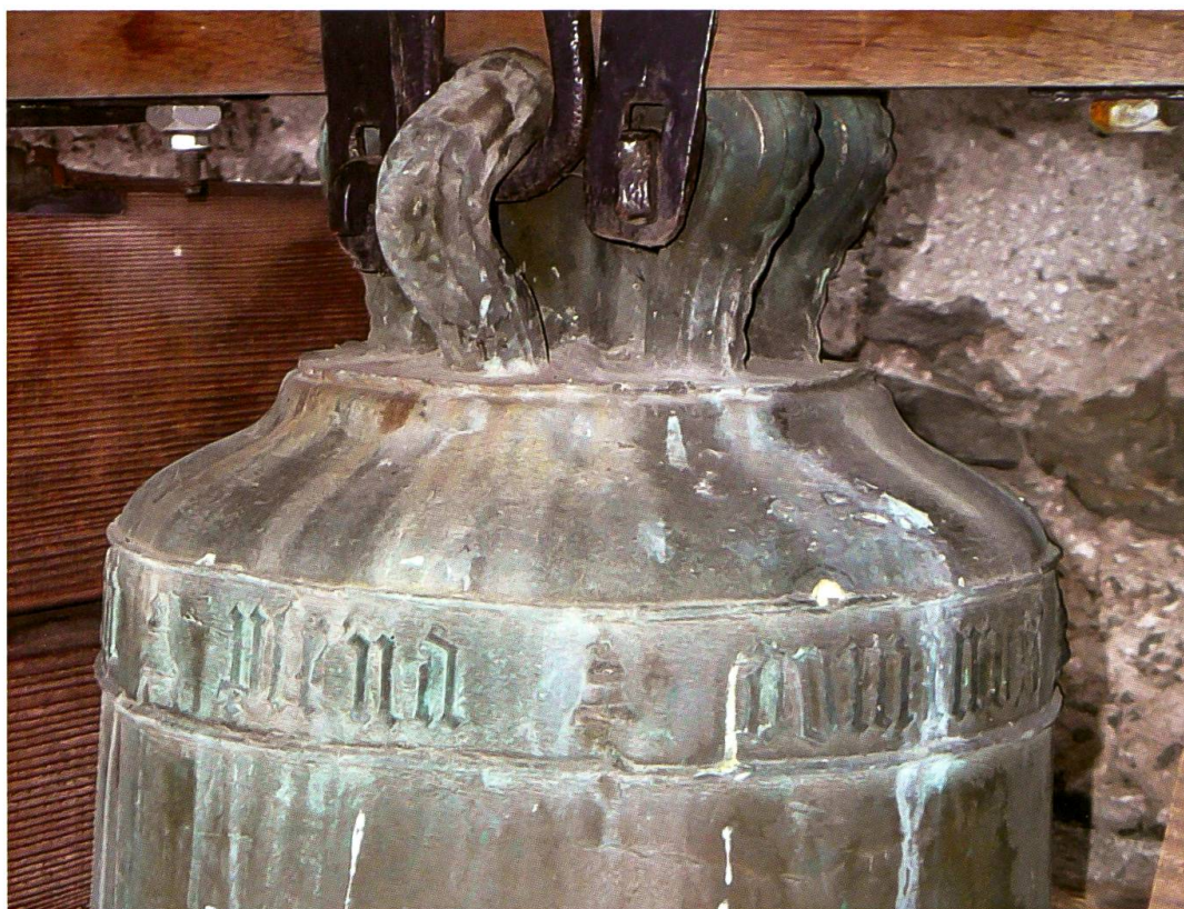
Borgonovo, chiesa di San Giorgio, campana da morto (anonimo, XV sec.): dettaglio della parte superiore

La campana di Nossa Dona rappresenta un caso eccezionale sotto vari punti di vista. Anzitutto, si tratta di una campana singola, di grandi dimensioni (dm. alla bocca: 124 cm), ancora oggi suonabile solo manualmente. Di sagoma gotica, la campana presenta un gradino inferiore in forma di tondino in rilievo e una corona a sei maniglie semplici, appena profilate con leggere linee verticali in rilievo sugli spigoli. Sulla spalla, fra due linee decorate in forma di cordicella, corre l'iscrizione, estremamente curata, in caratteri gotici sagomati, minuscoli nel testo e maiuscoli per la lettera iniziale di ciascuna delle quattro parti in cui si divide l'iscrizione latina. La prima parte contiene la datazione ("Nell'anno del Signore 1491"); la seconda è una preghiera nota esclusivamente da iscrizioni campanarie e molto frequente in area tedesca in epoca medievale ("O re di gloria, vieni con la pace"); segue un breve assemblaggio di Ave Maria e Salve Regina ("Ave Maria, piena di grazia, madre di misericordia"); conclude l'iscrizione una sequenza con diverse abbreviazioni, probabilmente motivate dal poco spazio rimanente e verosimilmente interpretabili come O Gaudenti ora pro nobis – Joachimus de Castromuro ("O Gaudenzio prega per noi – Joachim von Castelmur"); si tratta di un'invocazione al santo evangelizzatore della Bregaglia seguita dal nome dell'uomo che si trovava allora a capo del casato