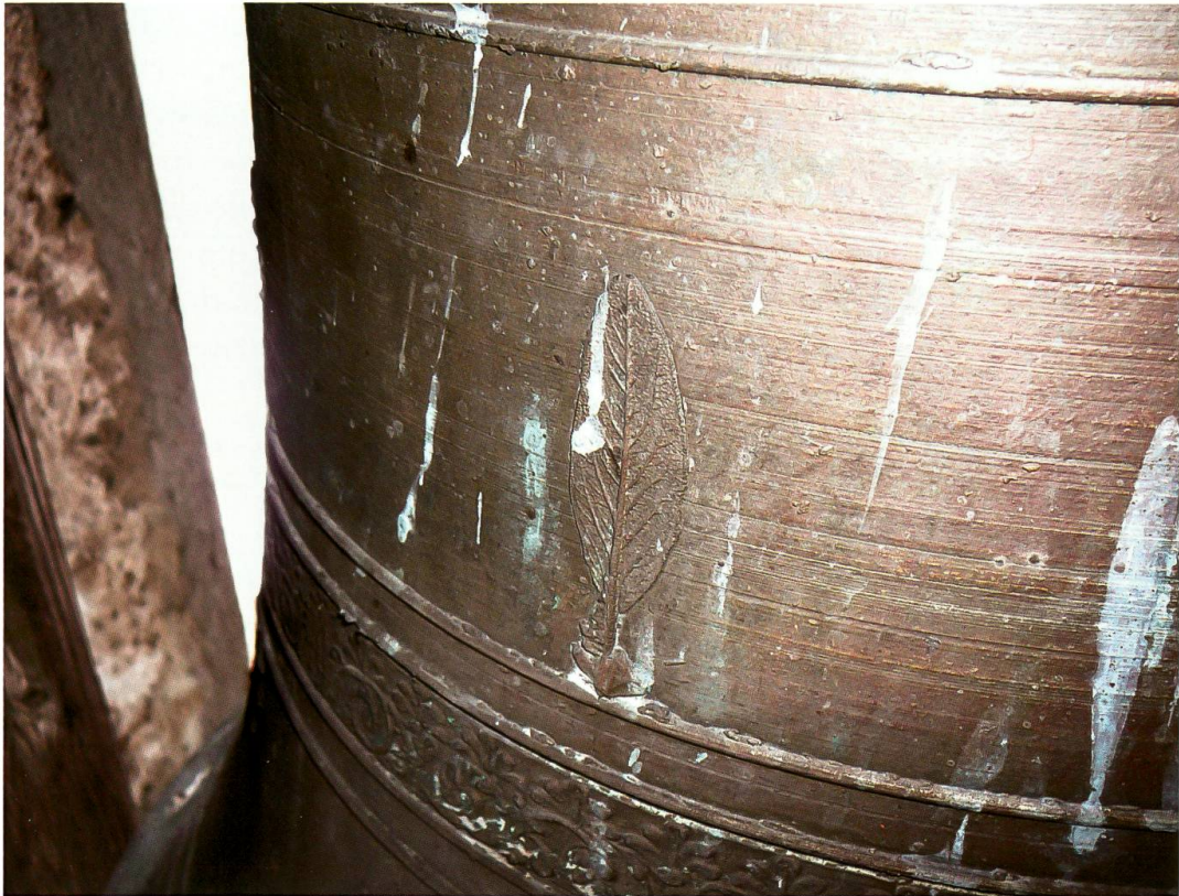
Borgonovo, chiesa di San Giorgio, seconda campana (Comolli, 1717): dettaglio delle foglie di salvia