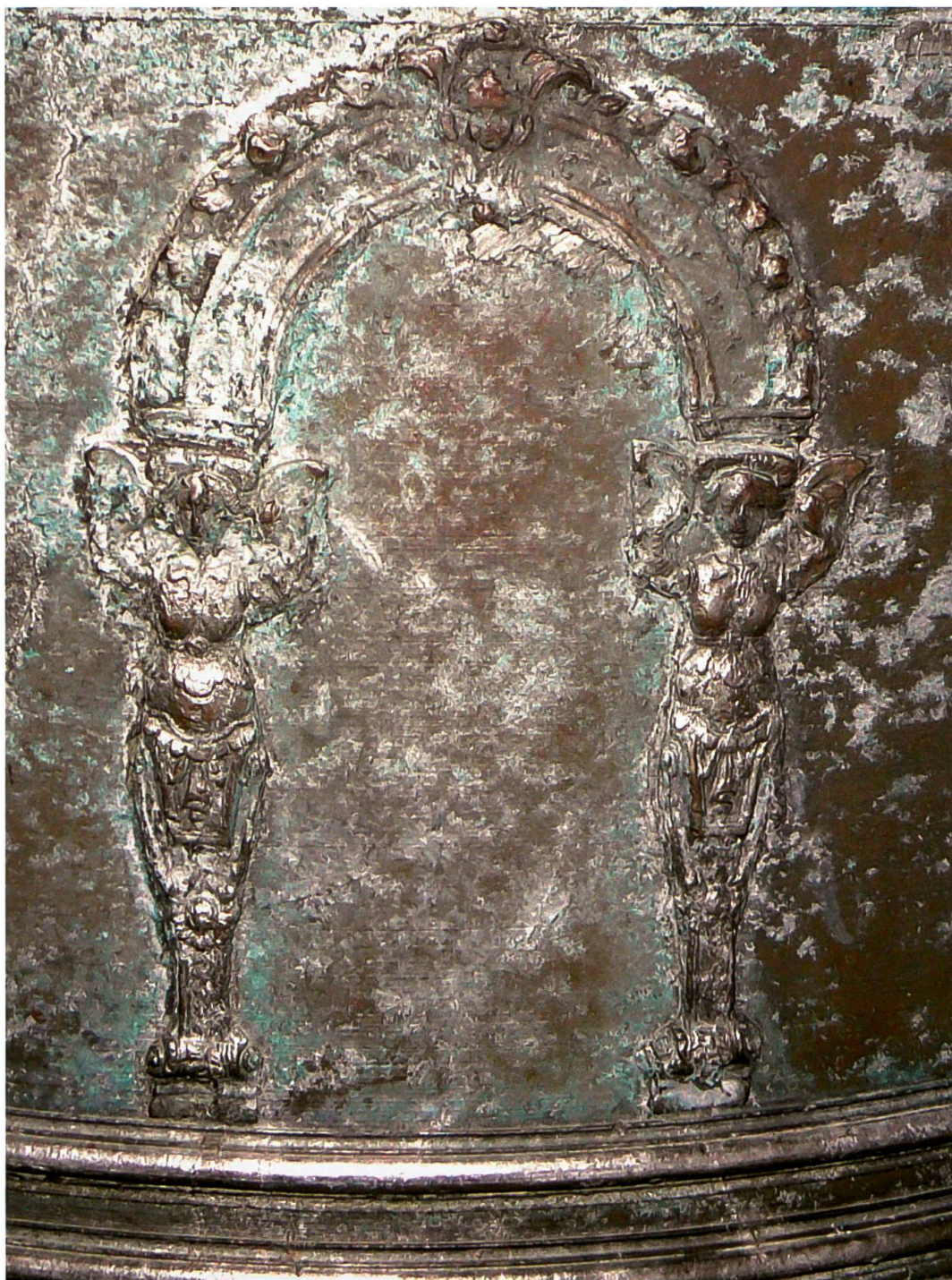
Vicosoprano, chiesa di San Cassiano, campana maggiore (Crespi, 1754): dettaglio delle edicole vuote