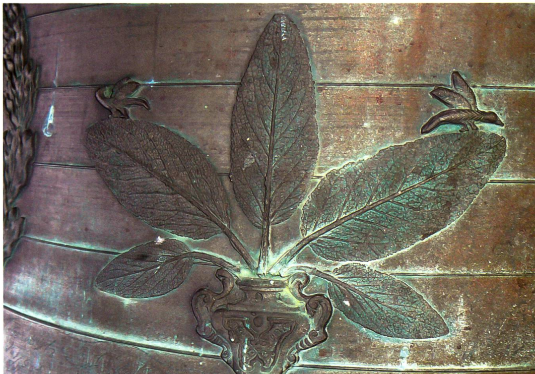
Casaccia, chiesa di San Giovanni, campana maggiore (Theus, 1871): dettaglio delle foglie di salvia

di realizzazione, identico a quello presente sull'altra campana. Al pari di quella di Vicosoprano, anche le due campane di Casaccia sono rifusioni di bronzi più antichi; delle vecchie campane, pare che la maggiore fosse stata realizzata nell'anno 1815, e che l'altra fosse una campana d'origine medievale proveniente dalla distrutta chiesa di San Gaudenzio. 74