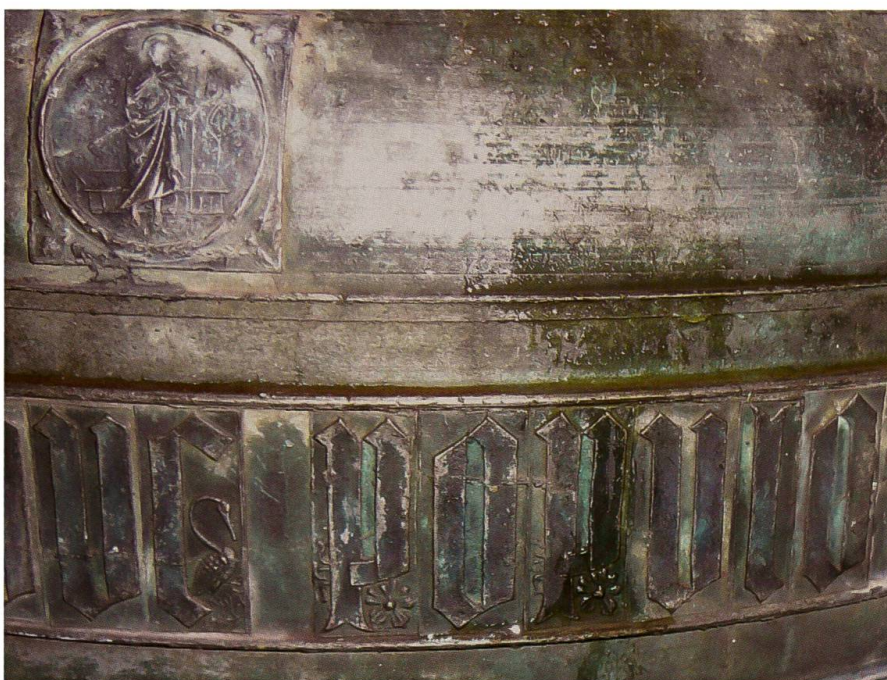
Bondo, chiesa di San Martino, campana maggiore (Jean de Maulain, 1523): dettaglio dell'iscrizione con la figura del Cristo Risorto

Numerosi elementi stilistici, iconografici ed epigrafici indicano che il fonditore di questa campana fosse di cultura francese, ma la sua identificazione con Jean de Maulain si basa su confronti con altre campane e documenti d'archivio nel Cantone dei Grigioni, nell'Italia settentrionale e nella Francia orientale. Lo stemma del fonditore, precedentemente descritto e caratterizzato dai due angeli, è noto sulle seguenti campane, peraltro tutte molto somiglianti a quella maggiore di Bondo per impianto decorativo e iconografico: Pontresina, San Nicolò (1521); 26 Palù del Fersina, Santa Maria Maddalena (1521, non più esistente); 27 Pergine Valsugana, San Cristoforo al Lago (1522); 28 Vicenza, Duomo (1526); 29 Mathon (1528). 30 Lo stesso stemma è però impresso anche su campane recenziore,