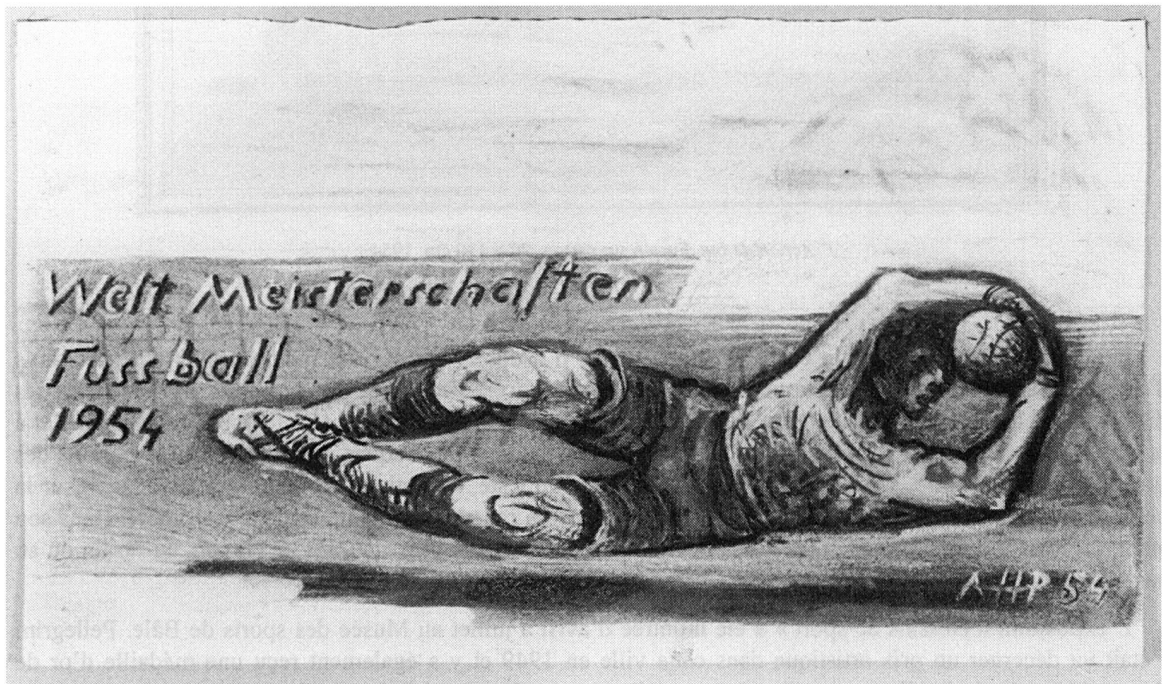
Coupe du monde football 1954. Fusain sur papier à dessin, 25,9 × 43,4 cm. Croquis pour les Basler Nachrichten, 16/18 juin 1954

Depuis la fondation de la Bibliothèque nationale, le Cabinet des estampes recueille et met à la disposition des visiteurs des documents iconographiques sur la géographie, la culture et l'histoire suisses. Elle possède entre autres des documents touchant au domaine sportif.