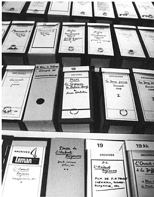
Le Fonds Jacques Chessex au moment de sa réception.

nue une œuvre qui s'enrichit considérablement. Les romans et les récits se multiplient : L'Ardent Royaume (1975), Les Yeux jaunes (1979), Judas le Transparent (1982), Jonas (1987), Morgane Madrigal (1990), La Trinité (1992), Le Rêve de Voltaire (1995), La Mort d'un Juste (1996). Les nouvelles donnent naissance à deux recueils : Le Séjour des morts (1977), Où vont mourir les oiseaux (1980). La poésie à laquelle Chessex revient périodiquement se traduit par plusieurs nouveaux livres : Élégie soleil du regret (1976), Le Calviniste (1983), Comme l'os (1988), Les Aveugles du seul regard (1991), Les Élégiés de Yorick (1994). Des chroniques et morceaux émergent deux titres : Reste avec nous (1969) et Feux d'orée (1984). Jacques Chessex s'affirme également dans la critique littéraire : Charles-Albert Cingria (1967), Les Saintes Écritures (1972), Bréviaire (1976), Flaubert ou le Désert en abîme (1991). Il y aurait lieu de mentionner encore les contes, les écrits sur l'art, les préfaces et autres collaborations. Durant toutes ces années, Jacques Chessex a aussi régulièrement collaboré à de nombreuses revues ainsi qu'à des journaux, notamment 24 Heures de 1970 à 1991 ( Humorales ), puis Le Nouveau Quotidien en 1992 et 1993 ( Chronique de Jacques Chessex ).