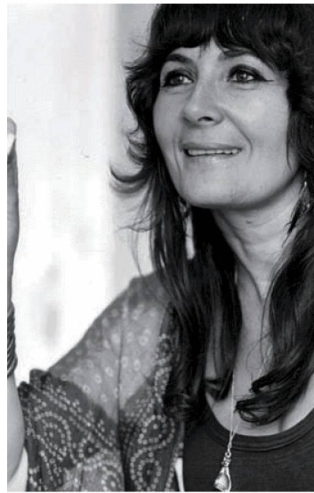
Grisélidis Réal