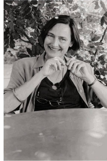
Anna Felder

POULET, Georges (1902–1991): Lettres et cartes postales autographes adressées par Georges Poulet à Jean-Pierre Richard. Don de Jean-Pierre Richard.