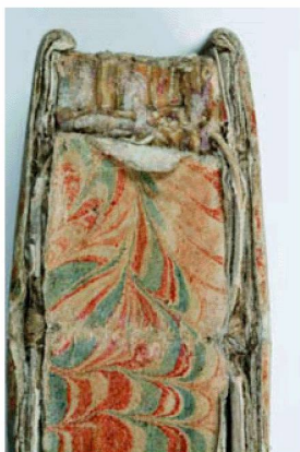
Avant les travaux de conservation : dos de livres, affiches