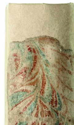
Après les travaux de conservation : dos de livres, affiches

La collection de documents nés numériques 14 s'est accrue de 2493 publications et comprend quelques 11 millions de fichiers pour un total de 136 gigabytes (en 2008, 1406 publications, 15 300 fichiers, 7,91 gigabytes). On relèvera en particulier la publication en ligne de la Feuille officielle suisse du commerce . L'édition quotidienne comprend environ 1500 entrées qui sont archivées et conservées à long terme avec leur certification légale. Les sites internet d'importance patrimoniale continuent à être collectés en collaboration avec les bibliothèques cantonales suisses. Le développement de l'outil de consultation de la collection électronique se poursuit selon les plans. Il devrait être opérationnel à la fin de 2010.