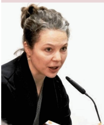
Melinda Nadj Abonji, 2.3.2011