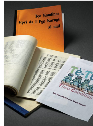
Archives de Theo Candinas

ROULET, Daniel de (*1944) : Le fonds comprend la totalité des manuscrits des œuvres, des articles et des travaux critiques de l'auteur ; 61 grands cahiers de notes, véritable laboratoire de l'œuvre (avec des brouillons, des plans, des journaux de voyages, des ébauches de correspondance, des listes de titres...) ; une vingtaine de classeurs de correspondance ; des documents personnels relatifs aux différents métiers exercés par l'auteur, à ses études ; une collection d'agendas et de petits carnets de notes et du matériel audio et vidéo. (Don)