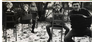
Dieter Roth, die frage nach familie, stühlen und katze, 1968, Photographie de la famille Stauffer, 1967 (modèle pour le travail de Dieter Roth)