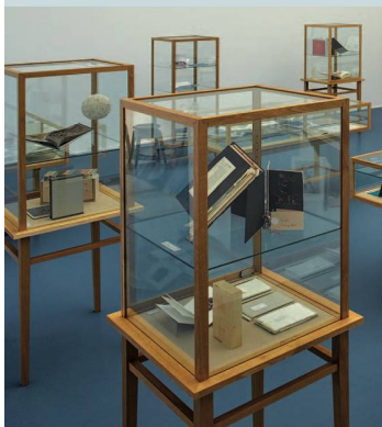
Unikat – Unicum, 22.11.2014– 28.2.2015