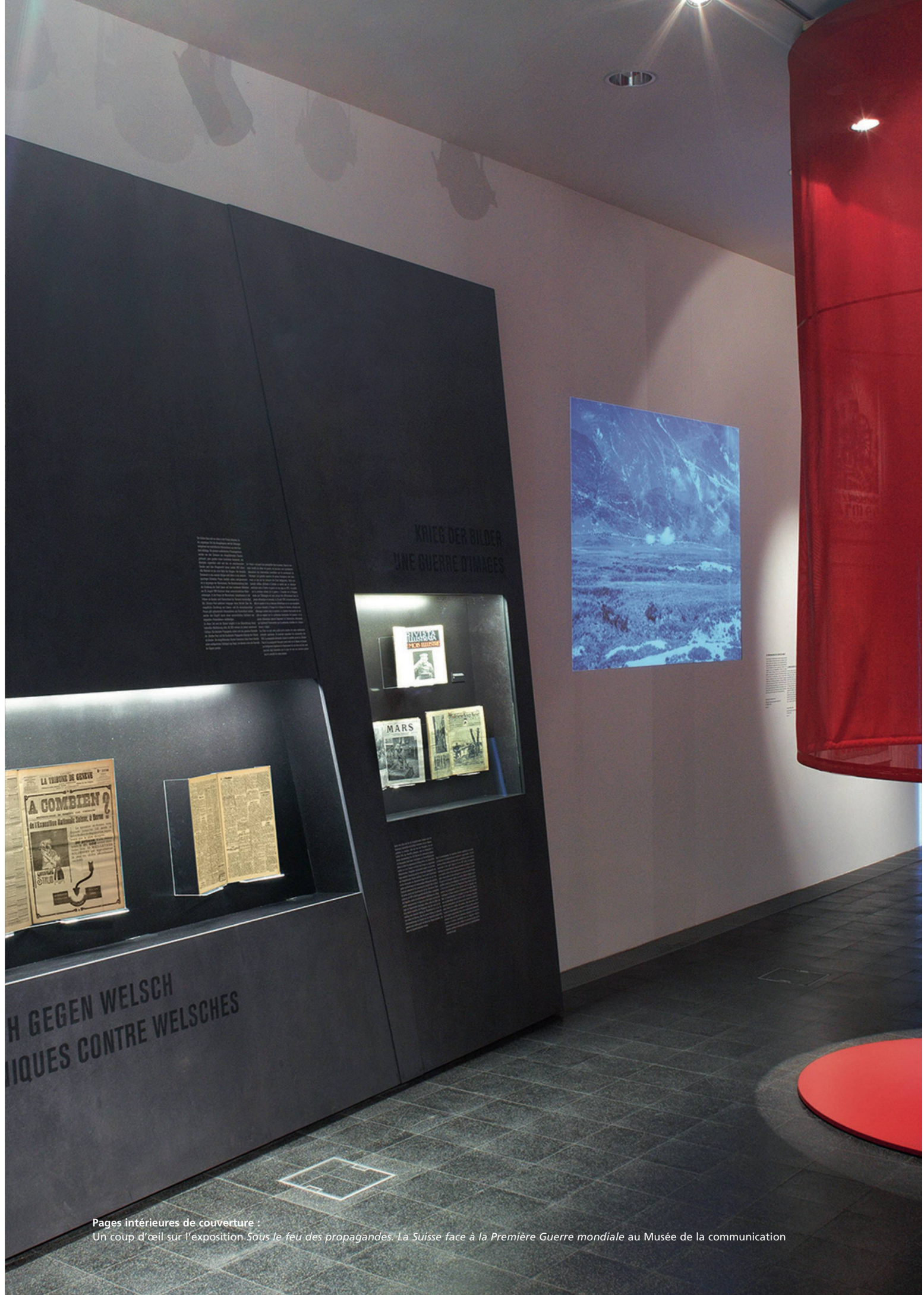
Pages intérieures de couverture : Un coup d'œil sur l'exposition Sous le feu des propagandes. La Suisse face à la Première Guerre mondiale au Musée de la communication