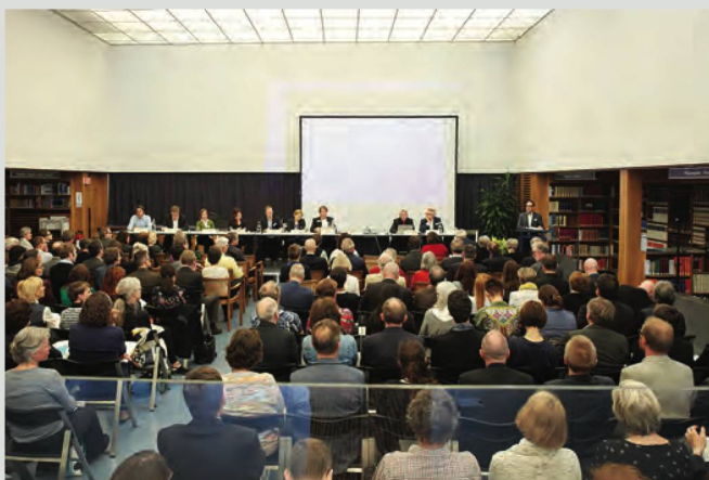
Le 14 mai 2018, l'assemblée générale du SBVV a réuni près de 170 personnes à la BN