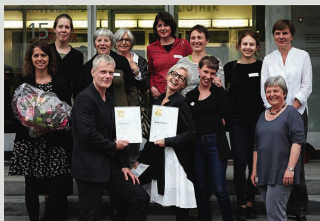
Les lauréats des différents prix remis par le SBVV réunis devant la BN