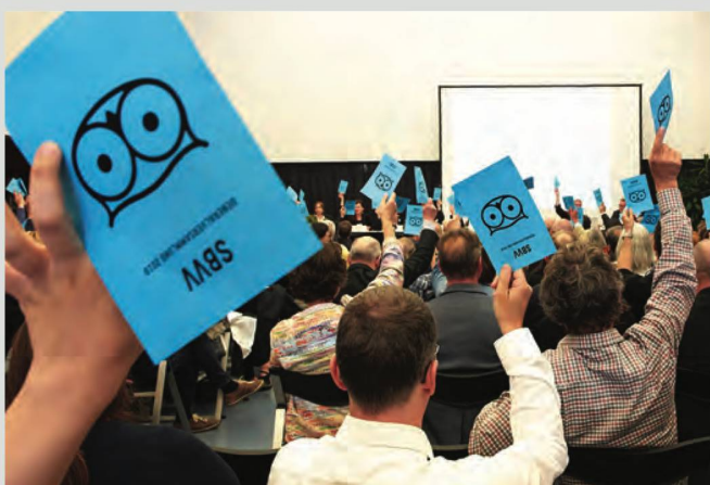
L'Assemblée annuelle du SBVV se tenait pour la première fois à la BN