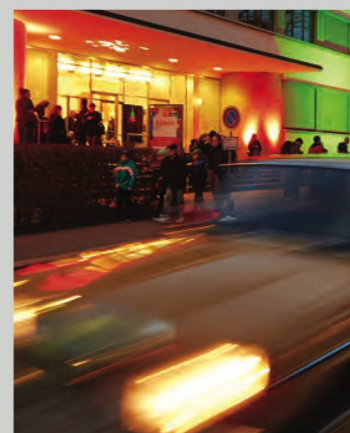
Une atmosphère particulière devant la BN avec le bal des voitures du Old Timer Club de Berne naviguant entre les différents sites participant à la Nuit des musées

Le deuxième workshop consacré à ce thème, organisé par les Archives littéraires suisses (ALS) a rassemblé des chercheurs et des spécialistes à la fois des archives et de l'épistolaire, venus de France et de Suisse. Il s'est agi notamment d'analyser les réseaux épistolaires d'écrivains, qui ont parfois permis l'affirmation et la consolidation de groupes littéraires. Par le biais de quelques cas concrets, comme Flaubert, Proust, Hesse, Robert Walser, ou encore Georges Borgeaud, cette journée a parcouru les principaux enjeux liés aux correspondances en réseaux entre les écrivains. Des questions importantes ont également été soulevées quant au tournant numérique et à son impact sur l'avenir des échanges par lettres.