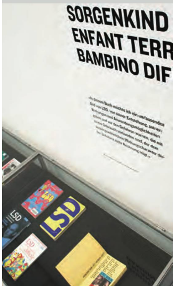
À l'occasion de l'exposition LSD, un enfant terrible de 75 ans , le livre du chimiste Albert Hoffmann a été présenté sous plusieurs éditions et en plusieurs langues

Le succès de librairie d'Albert Hofmann, LSD, mon enfant terrible , a servi de base à l'exposition qui a retracé l'histoire mouvementée du LSD. En 1943 le chimiste suisse Hofmann faisait la découverte des effets hallucinogènes du LSD après avoir lui-même absorbé cette substance. Le LSD a influencé la littérature, l'art, la musique et la société comme aucun autre produit chimique. Ironie de l'histoire, la première interdiction partielle du LSD en Suisse remonte à 1968, année bien connue, mais pour d'autres raisons ! L'exposition s'est aussi intéressée aux utilisations actuelles, illégales ou médicales de cette substance qui, d'« enfant terrible », pourrait un jour devenir « enfant prodige ». Plusieurs objets présentés, provenant des collections de la BN ou reçus en prêt, étaient pour la première fois accessibles au public. Cette exposition a attiré un nombre record de visiteurs.