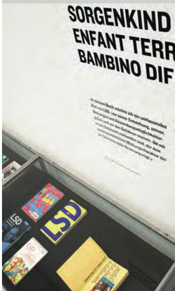
À l'occasion de l'exposition LSD, un enfant terrible de 75 ans , le livre du chimiste Albert Hoffmann a été présenté sous plusieurs éditions et en plusieurs langues