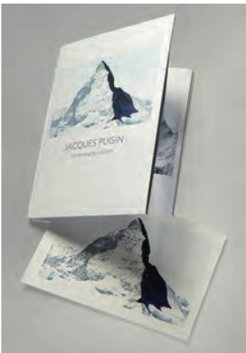
Pugin, Jacques, La montagne s'ombre , 2018