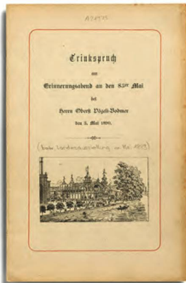
Hardmeyer, Jakob, Trinkspruch , 1890