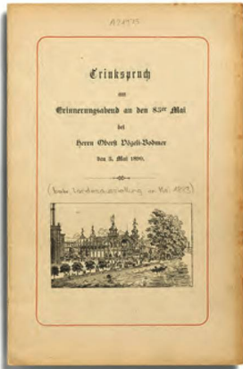
Hardmeyer, Jakob, Trinkspruch , 1890