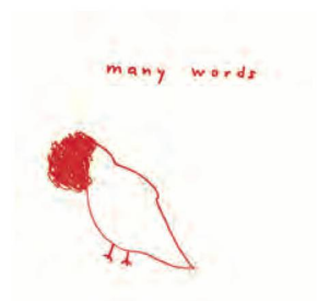
Peter Clemens Brand, many words , 2013, Éditions Benjamin Dodell