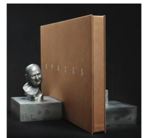
Urs Lüthi, Serre-livres, 2011