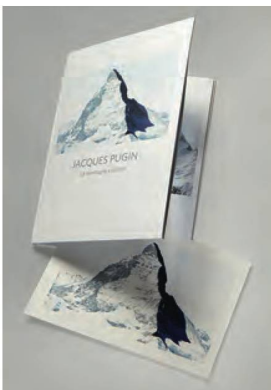
Pugin, Jacques, La montagne s'ombre , 2018