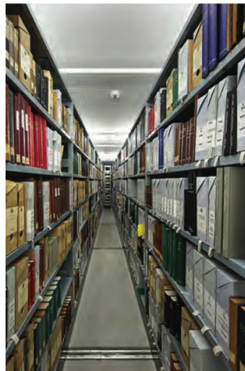
Le projet VIVA a permis le catalogage d'une documentation diversifiée sur la vie des associations et des institutions suisses

La BN collectionne ce qui est imprimé. Elle collectionne aussi ce qui est numérique. Le volume de la collection numérique a atteint environ 25 To à fin 2018 (21 To en 2017). À la fin de l'année sous rapport, les publications nées sous forme numérique comprenaient plus de 130 000 paquets d'archives, soit 20 % environ de plus qu'en 2017 (plus de 107 000). À cela s'ajoutent 42 577 paquets d'archives de documents numérisés (42 489 en 2017). Le projet de faire passer le système de stockage des e-Helvetica sur les serveurs de la Phonothèque nationale est en cours de finalisation.