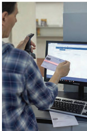
L'année 2018 aura été marquée par le passage à un nouveau système de gestion de bibliothèque