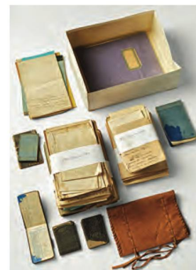
Carnets d'écriture de Chasper Po

ZYTGLOGGE: Il s'agit du fonds des éditions Zytglogge, maison fondée à Berne en 1965 et qui est devenue également un label discographique. Le fonds est constitué de quelque 1400 supports audiovisuels (LP, CD, cassettes, DVD et VHS) en provenance du fonds Zytglogge conservé à la Burgerbibliothek de Berne.