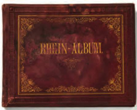
Album des Rheins , vers 1860