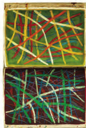
Christoph Hauri, Grosses Malbuch , livre d'artiste à exemplaire unique, 2003