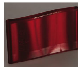
Le dictabelt est un support sonore gravé. La collection de la BN en est riche