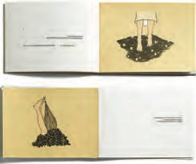
La vie a quelque chose du vide entre chaque battement d'ailes de papillon , 2019