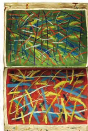
Christoph Hauri, Grosses Malbuch , livre d'artiste à exemplaire unique, 2003