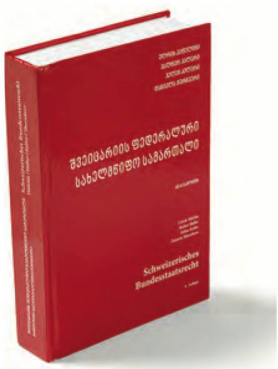
Schweizerisches Bundesstaatsrecht , traduction en géorgien, 2019