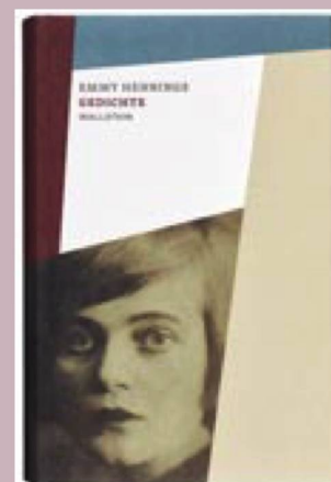
Gedichte d'Emmy Hennings