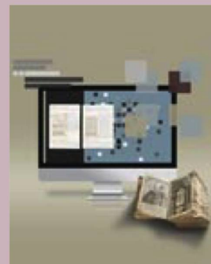
Exposition virtuelle Jean Starobinski. Relations critiques

La Phonothèque nationale suisse a participé au projet Cultura in movimento organisé par le canton du Tessin à l'occasion de l'inauguration du tunnel de base du Ceneri. Prévue pour faire le tour des musées tessinois, l'exposition a dû, Corona oblige, passer en format virtuel. La Phonothèque nationale a rassemblé une sélection de documents sonores historiques qu'elle a publiés sur son site à l'occasion de l'inauguration du tunnel le 13 décembre 2020. Interviews, reportages, entretiens ou chants d'époque de l'ancienne malle-poste qui franchissait le Gothard jusque vers la fin du 19 e siècle : une galerie de souvenirs vivants qui part du développement des voies de communication, des changements de la société dans le Tessin et la Suisse du 20 e siècle et qui va jusqu'à la ligne à grande vitesse du 21 e siècle.