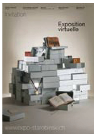
Manifestation consacrée à l'exposition virtuelle Jean Starobinski. Relations critiques