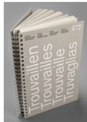
La publication Trouvaillen, Trouvailles, Trouvaille, Truvaglias , 2021

Les ALS ont organisé en 2021 à la Bibliothèque nationale un symposium national sur le thème des données numériques dans les archives, avec des intervenants et des participants représentant les institutions partenaires suivantes : les Archives littéraires allemandes de Marbach, l'Institut suisse pour l'étude de l'art SIK-ISEA, les archives Robert Walser, les archives Thomas Mann de l'ETH Zurich, la Bibliothèque centrale de Zurich, la fondation James Joyce de Zurich et la bibliothèque universitaire de Bâle.