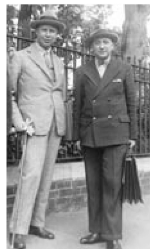
Piero Coppola avec Serge Prokofiev