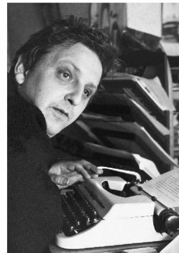
Peter Bichsel