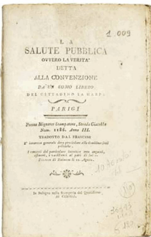
Frédéric César de La Harpe