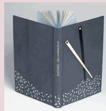
La rilegatura di Luca Stauffer premiata al concorso per rilegatori